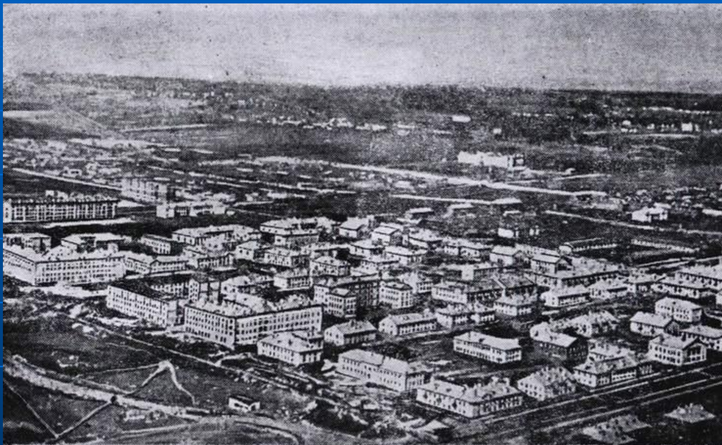
Общий вид Кировского района. Жилые кварталы построены в годы Великой Отечественной войны.