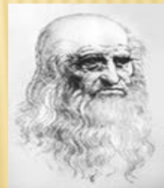
Леонардо да Винчи