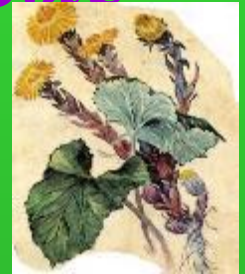
Мать и мачеха

Темной он покрыт корой, лист красивый вырезной, а на кончиках ветвей много много желудей.