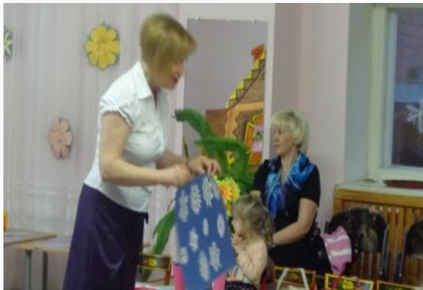
Рассматривание образцов снежинок.