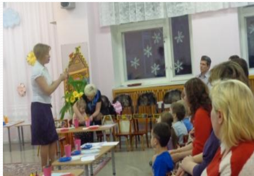
Показ способов изготовления.