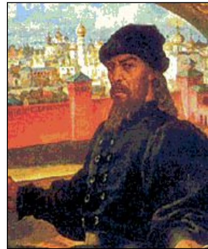
Великий князь всея Руси Иван III