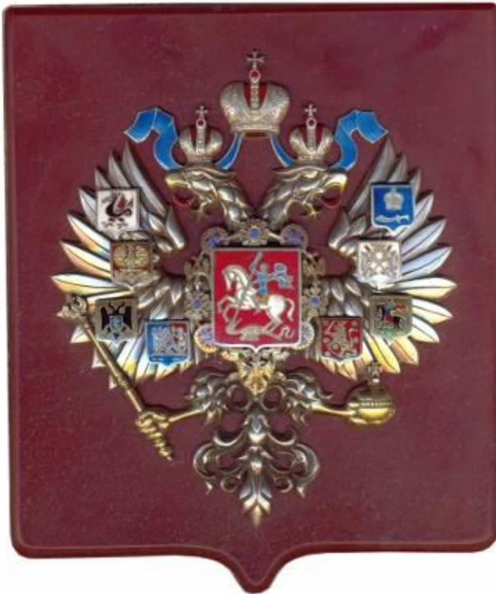
The Small Imperial Arms of Russia

Gold, silver, enamel, red marble, nut-tree box Embossment, engraving, enameling 160X140 2005