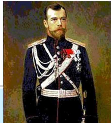
Николай II- последний российский император

Гимн слушают и поют стоя. мужчины снимают головные уборы, военные отдают честь.