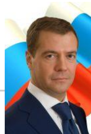
Президент Российской Федерации