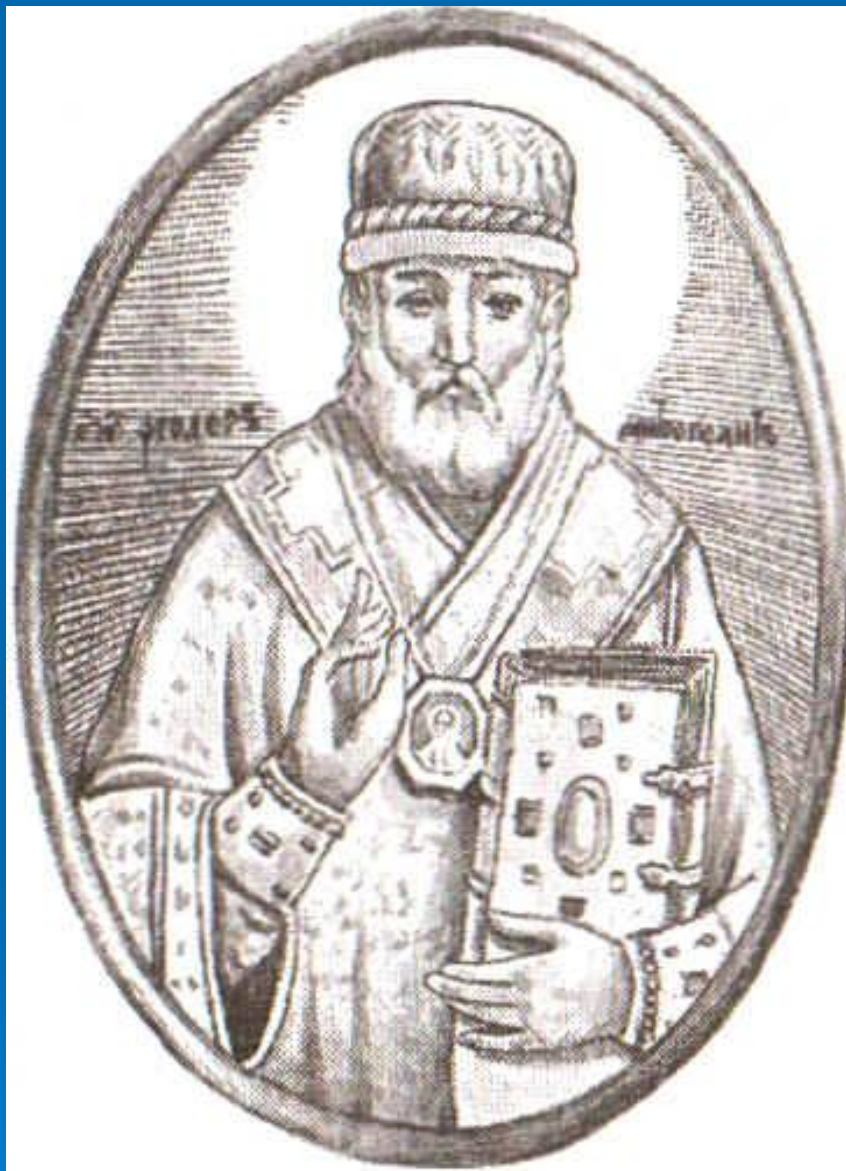
Митрополит Филипп (Ф. Колычев)