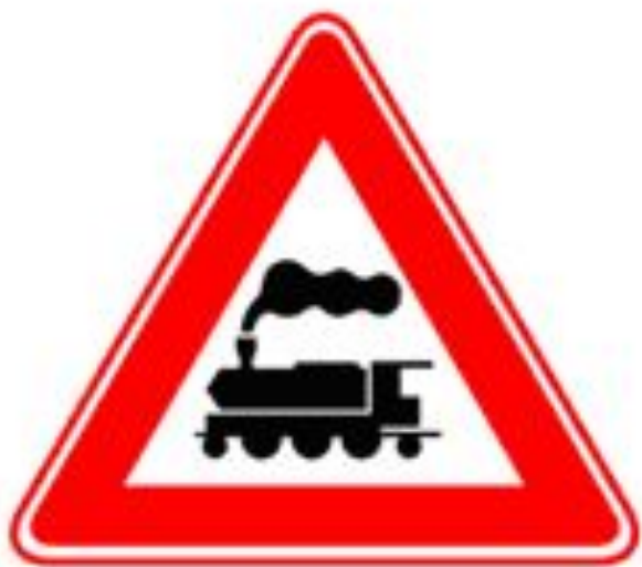
Железнодорожный переезд без шлагбаума