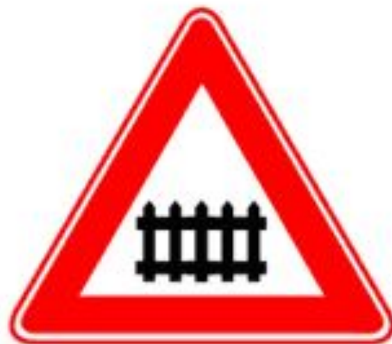
Железнодорожный переезд со шлагбаумом