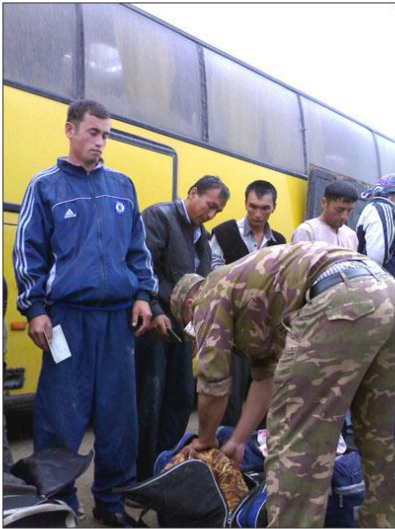
Пограничный досмотр на Казахстанской границе.