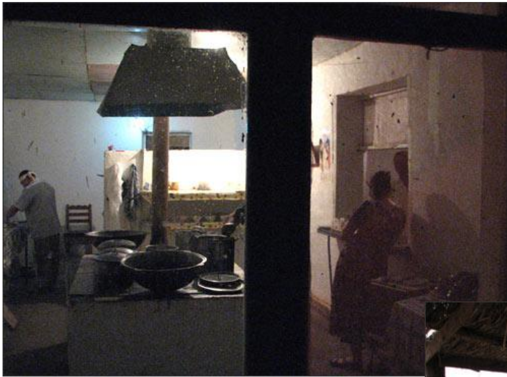
Столовая на пути следования в Казахстан. В пригороде Ташкента