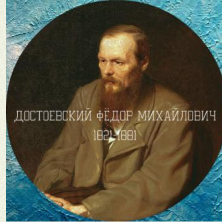
ДОСТОЕВСКИЙ ФЁДОР МИХАЙЛОВИЧ 1821-1881