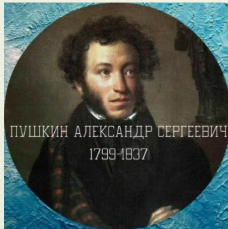
ПУШКИН АЛЕКСАНДР СЕРГЕЕВИЧ 1799-1837