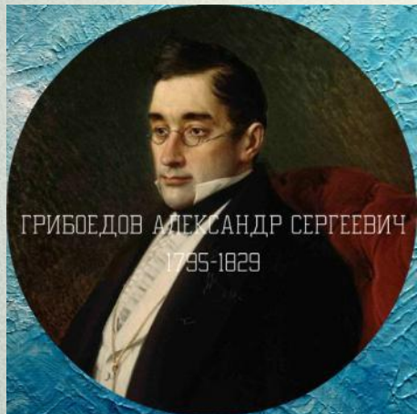
ГРИБОЕДОВ АЛЕКСАНДР СЕРГЕЕВИЧ 1795-1829