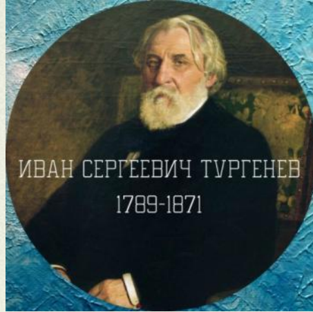
ИВАН СЕРГЕЕВИЧ ТУРГЕНЕВ 1789-1871