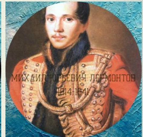
МИХАИЛ ЮРЬЕВИЧ ЛЕРМОНТОВ 1814-1841