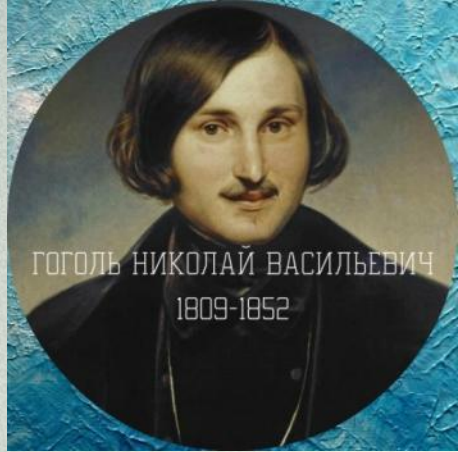
ГОГОЛЬ НИКОЛАЙ ВАСИЛЬЕВИЧ 1809-1852