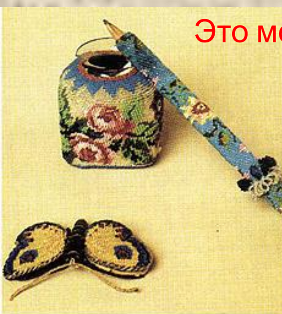
Перочистка, чернильница и карандаш. 1820—1840-е гг.