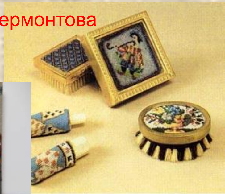
Ломберные щеточки и чехлы на мел. Начало XIX в.