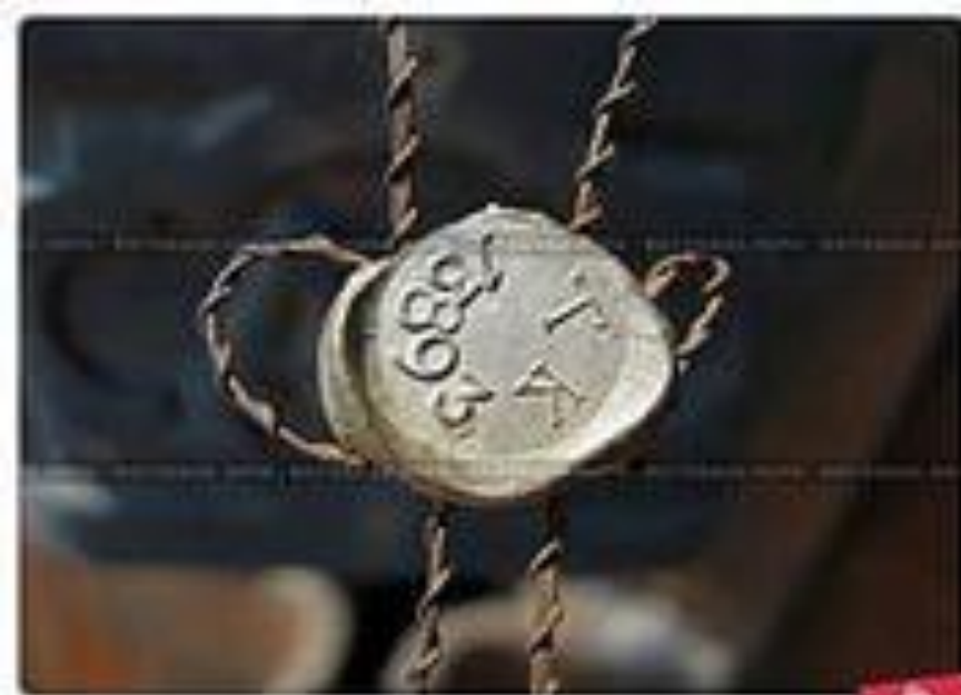
Пломба таможенного контроля в Таможенном Союзе и Евразийском Союзе