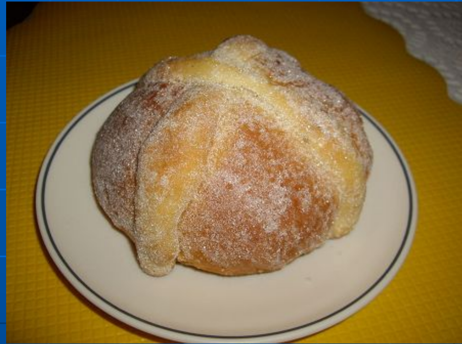
Хлеб Мёртвых — традиционная выпечка ко Дню Мёртвых