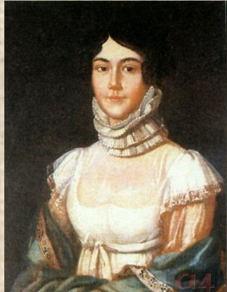
Портрет Марии Михайловны Лермонтовой