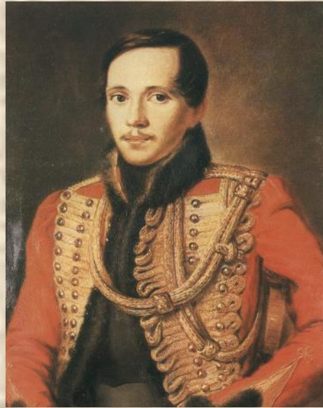
П. Е. Заболотский. Портрет М. Ю. Лермонтова.