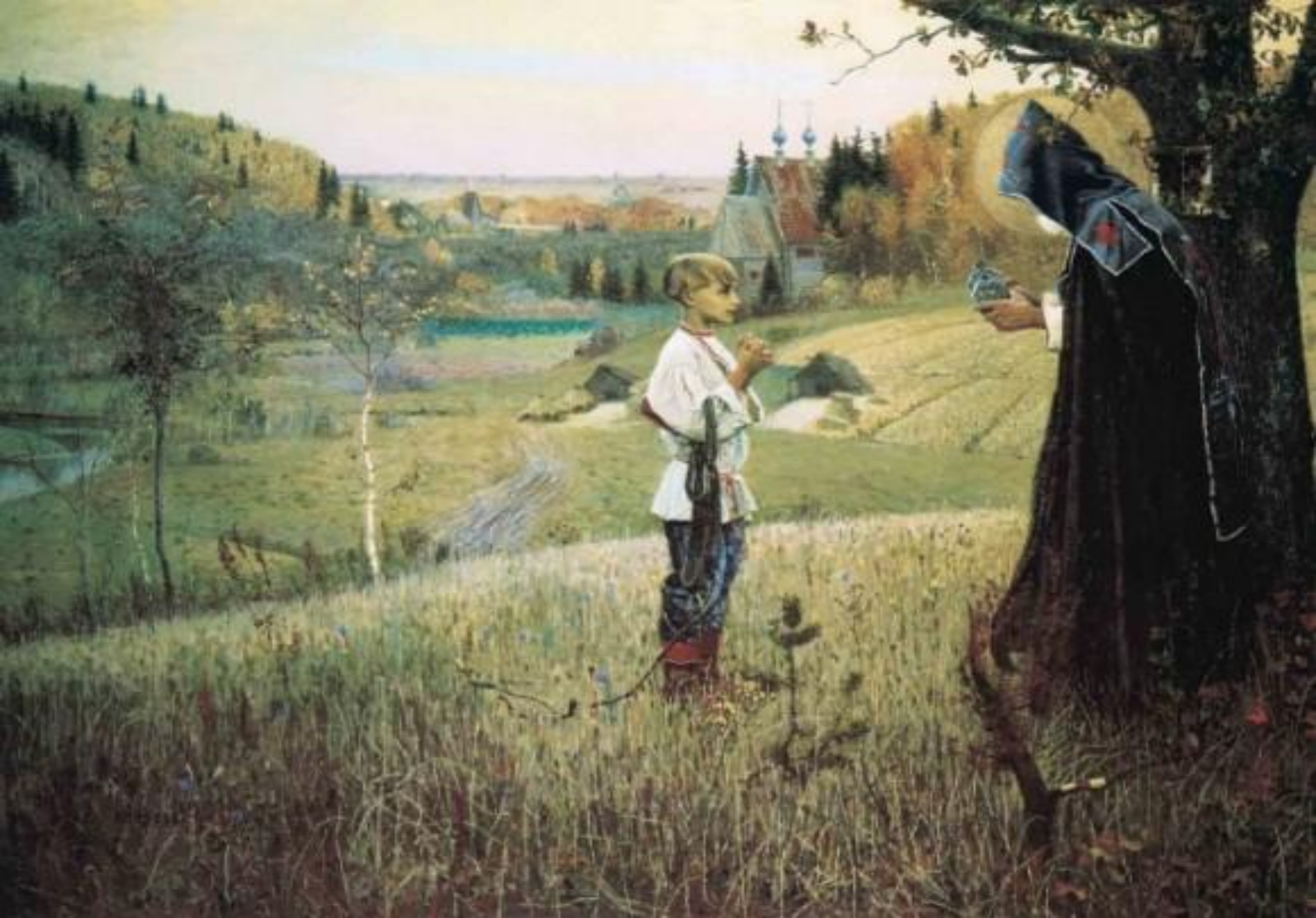
Видение отроку Варфоломею. Нестеров М.В