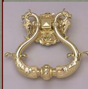
Дверь – Ручка в Царском дворце