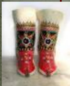
Черевички – хворостина

Предметно – бытовые детали и символические образы в зеркале рождественской ночи