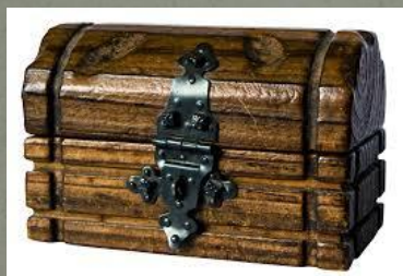
Сундук для Оксаны Хата с открытыми окнами