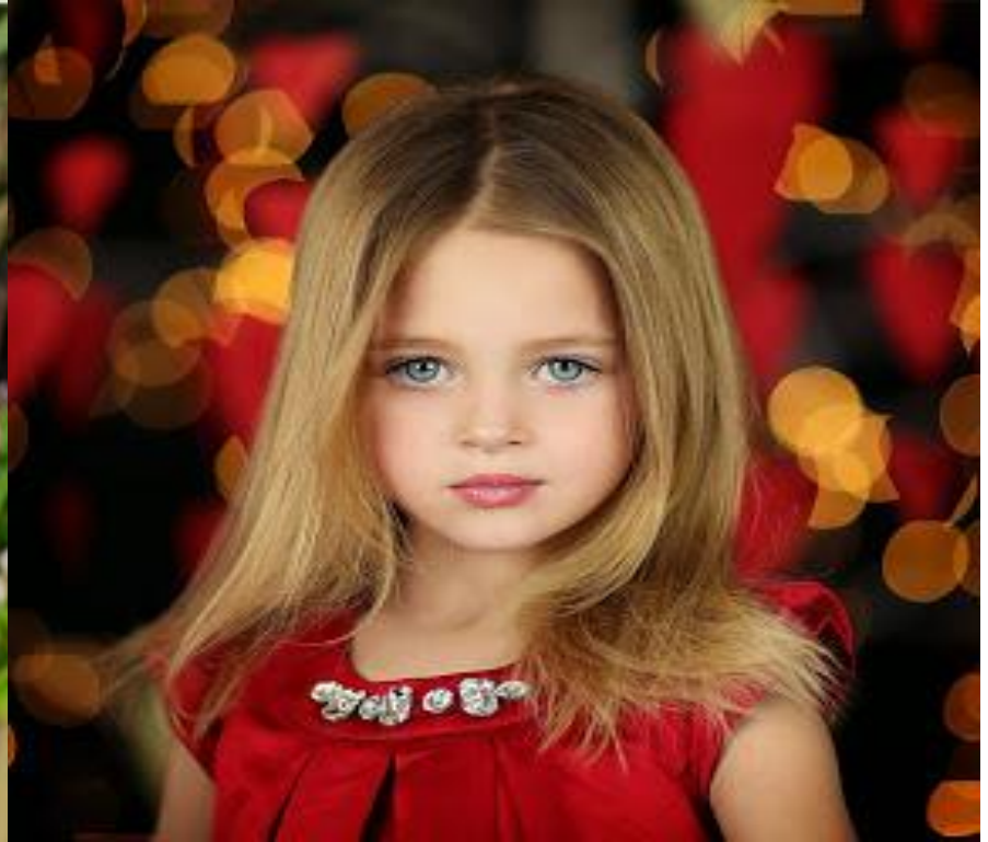
DAUGHTER ['dɔ:tər] УРУУ