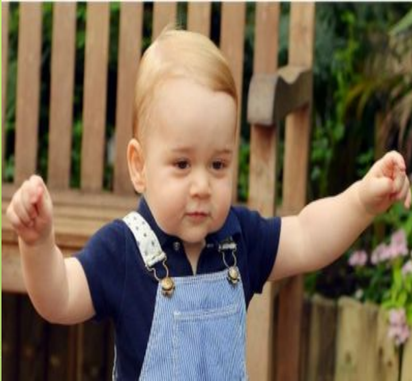
Son [sʌn] ОҒЛУ