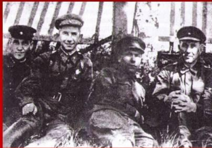
261-й Отдельный пулемётно-артиллерийский батальон