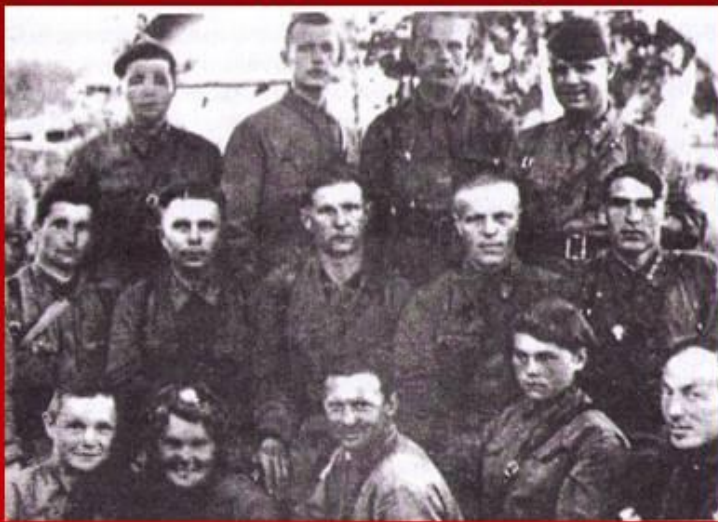
168-я стрелковая дивизия.

Оборону на рубеже Павловский парк, район деревни Фёдоровское, реки Славянка и Ижора обеспечивала 168-я дивизия. Оборонительный рубеж по линии Пушкин, Слуцк (Павловск), посёлок Фёдоровское, Антропшино удерживал 261-й Отдельный пулемётно-артиллерийский батальон.