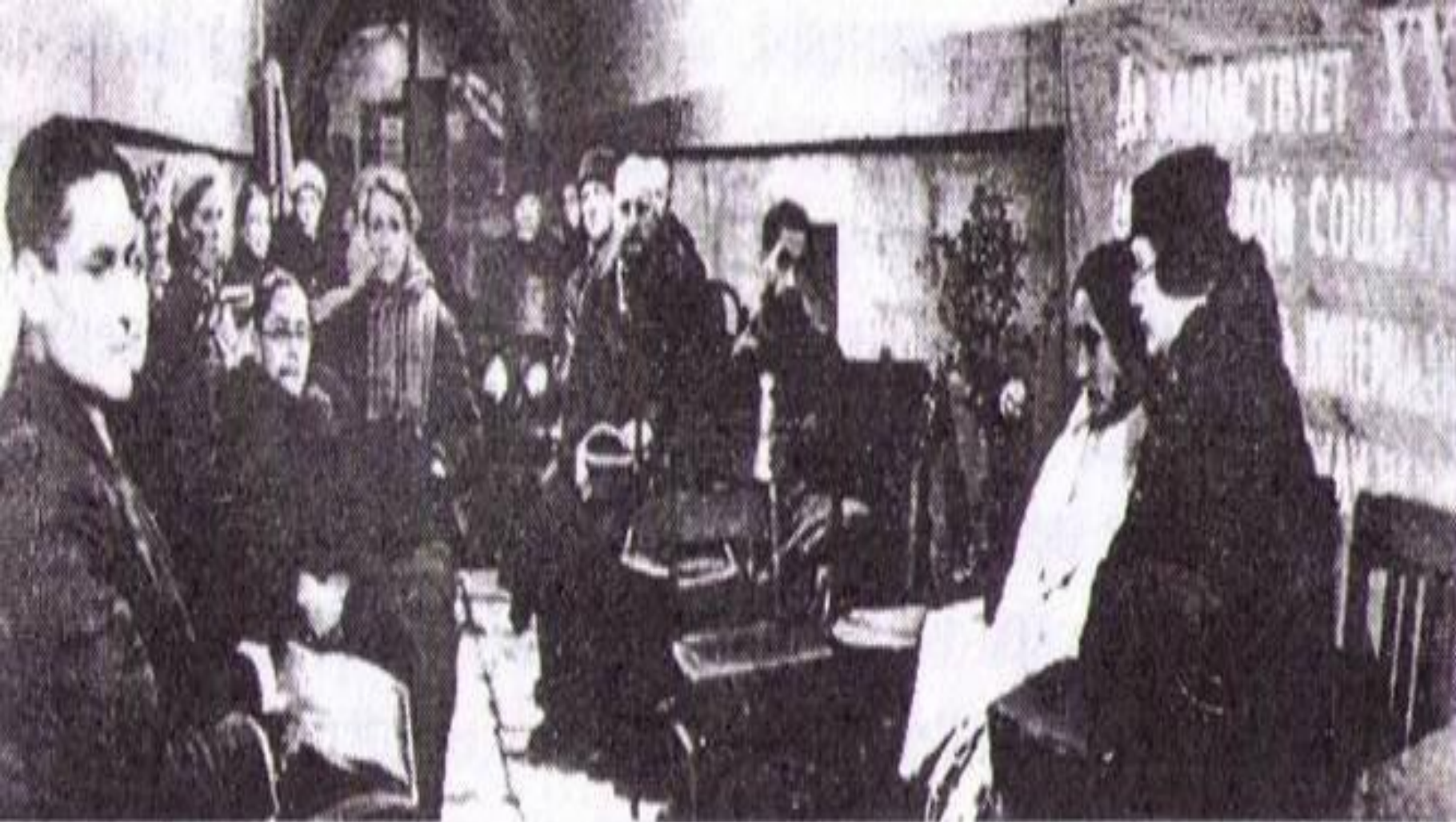
Работники пригородных дворцов-музеев в подвале Исаакиевского собора. 7 ноября 1941 года