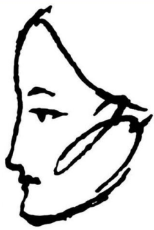
Н. Н. Гончарова рис. А. С. Пушкина

“Когда я увидел её в первый раз, я полюбил её, голова моя закружилась” – так пишет поэт о встрече с Натальей Гончаровой в декабре 1828 года. Не теряя ни минуты, он просил руки 16-летней Н. ы.