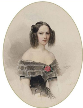
Н. Н. Гончарова Гау В.И. 1844