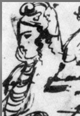
Каролина Собаньская в рисунках А.С.Пушкина

Встреча произошла в Одессе. Пушкин был очарован ею: красивая, веселая, изящная, живая, всесторонне образованная, любительница изящных искусств, прекрасная пианистка... Профиль Каролины поэт рисует на полях своих рукописей.