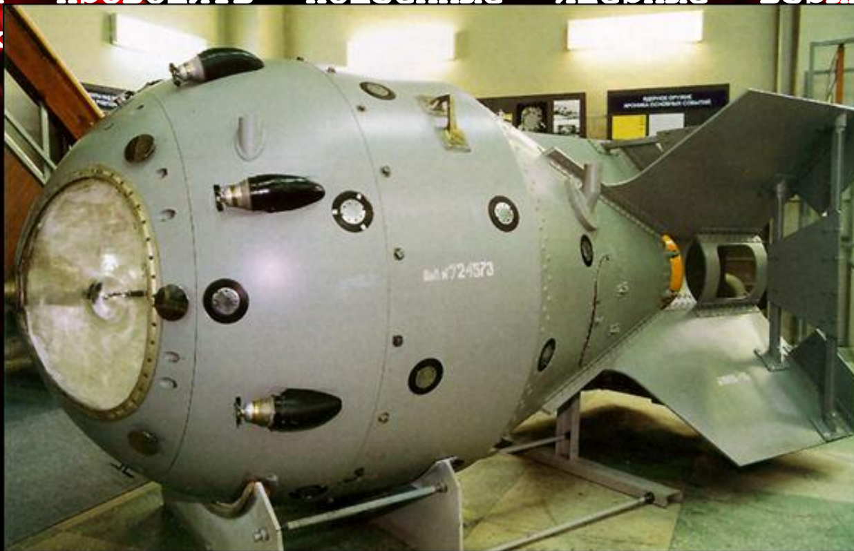
Первая атомная бомба РДС -1

первое испытание ядерного оружия в Советском Союзе было проведено 29 августа Первое испытание ядерного оружия в Советском Союзе было проведено 29 августа 1949 года Первое испытание ядерного оружия в Советском Союзе было проведено 29 августа 1949 года. Мощность бомбы составила 22 килотонны . Создание полигона было частью атомного проекта и выбор был сделан, как оказалось впоследствии, весьма удачно — рельеф местности позволил проводить подземные ядерные взрывы и в штольнях