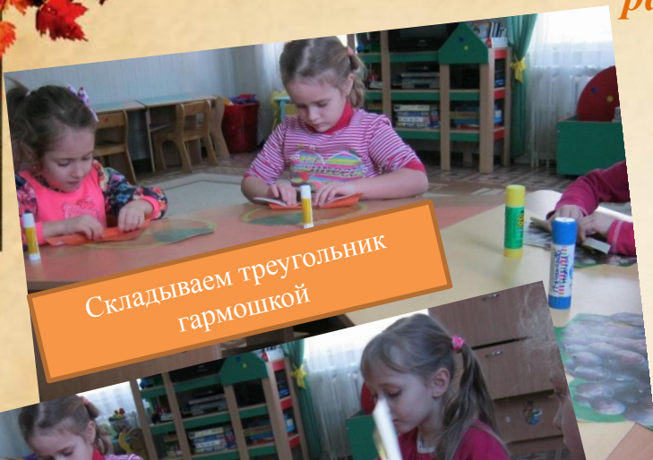
Складываем треугольник гармошкой