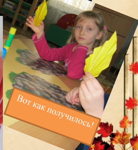
Вот как получилось!