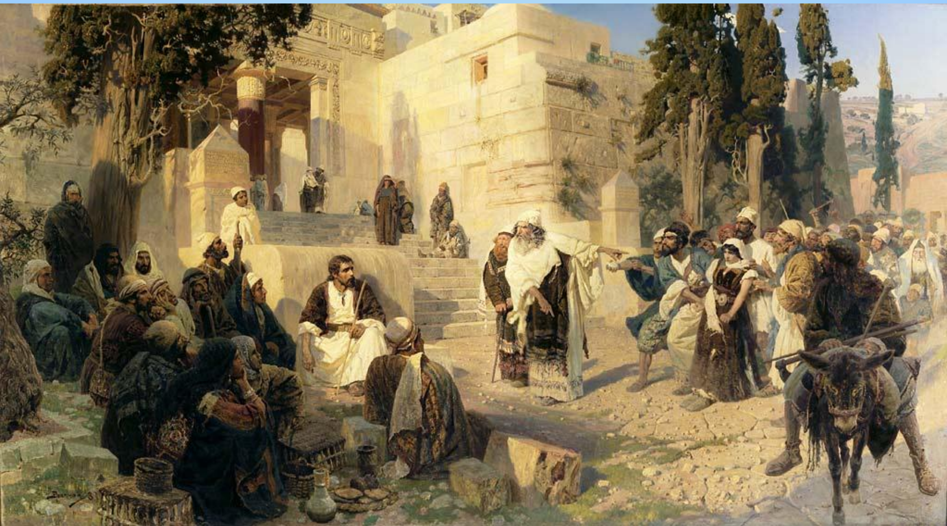
Поленов В.Д. «Христос и грешница»