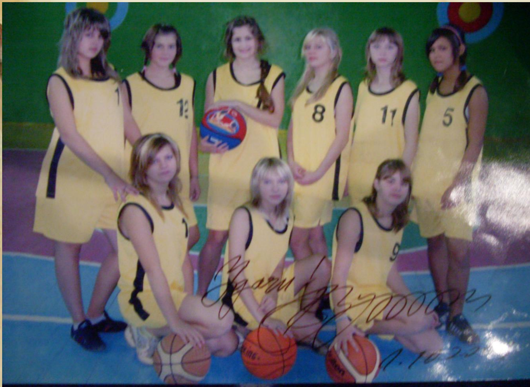
В.В.Путин пожелал нашей баскетбольной команде новых успехов и достижений.