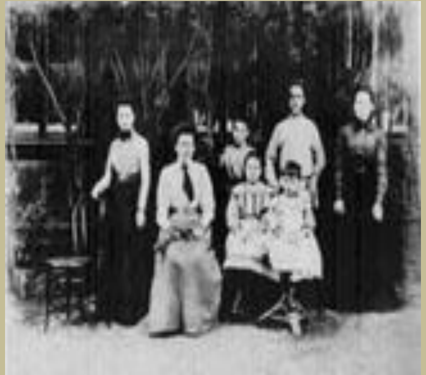
Семья Цветаевых в Тарусе.