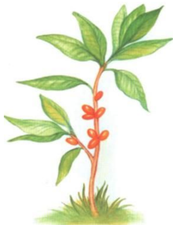
ВОЛЧЬЕ ЛЫКО (ядовитая)

Какое ядовитое растение леса связано с названием животного?