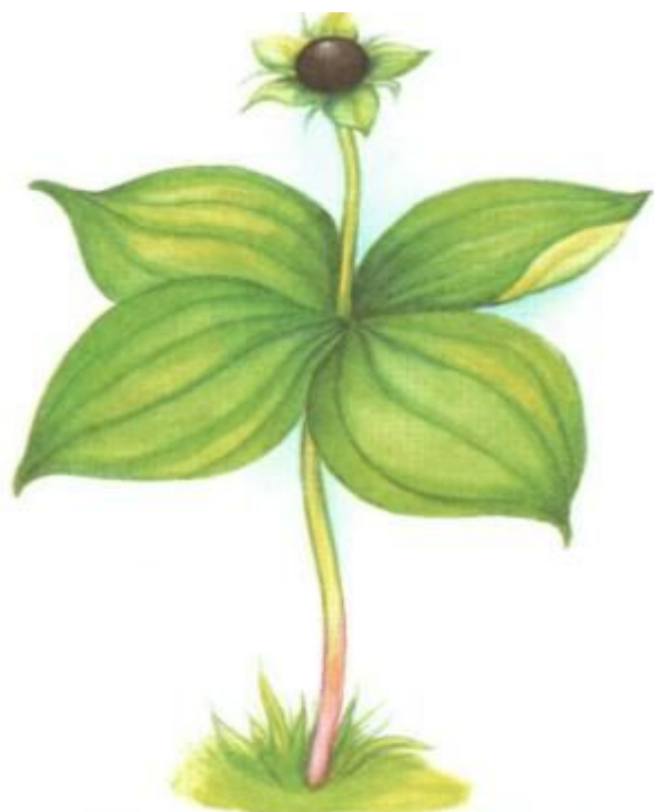
ВОРОНИЙ ГЛАЗ (ядовитая)

Какое ядовитое растение леса связано с названием птицы?