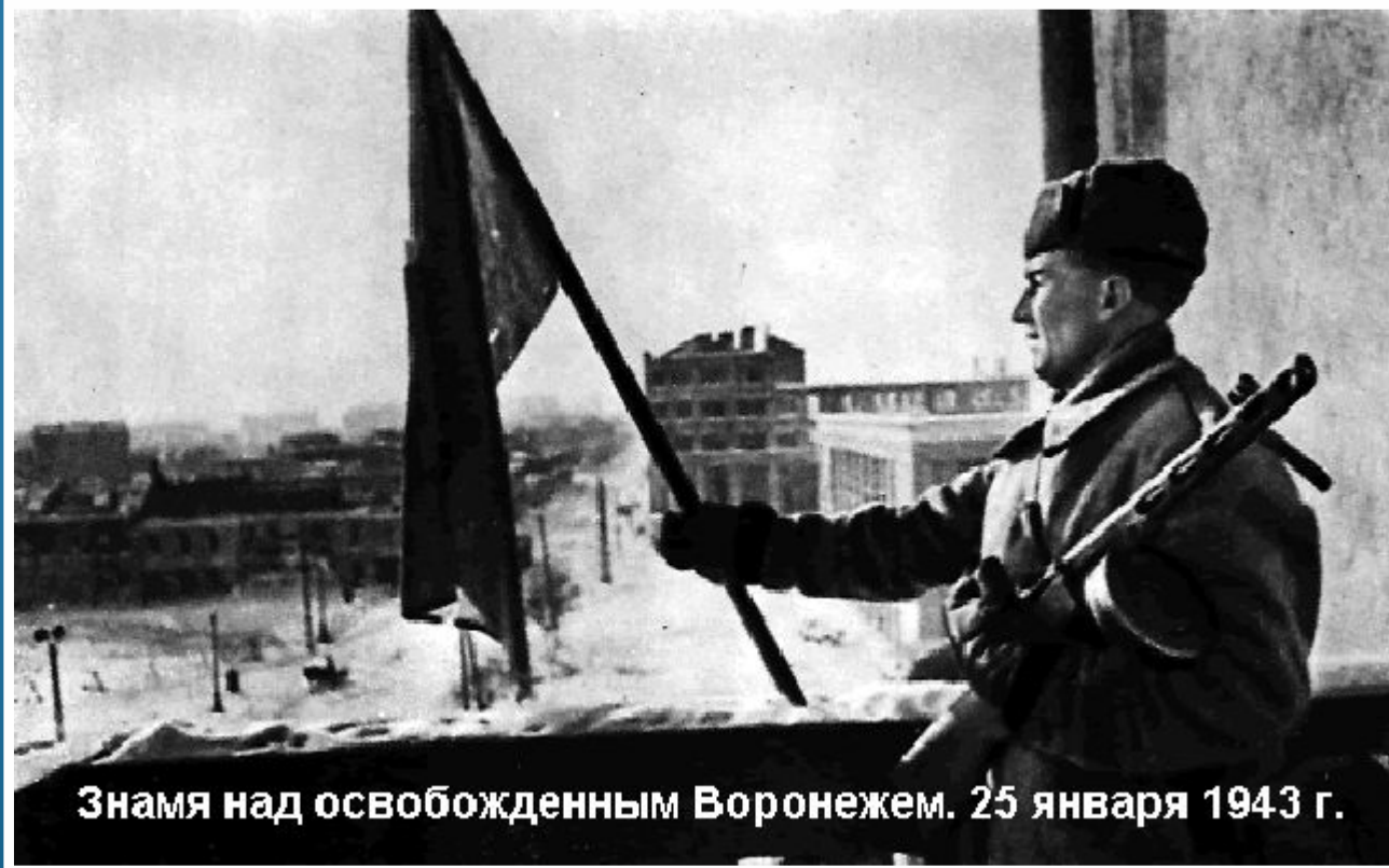
Знамя над освобожденным Воронежем. 25 января 1943 г.