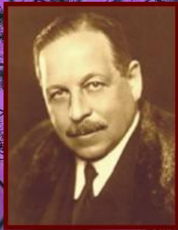
Имре Кальман (1882 — 1953 г.г.)