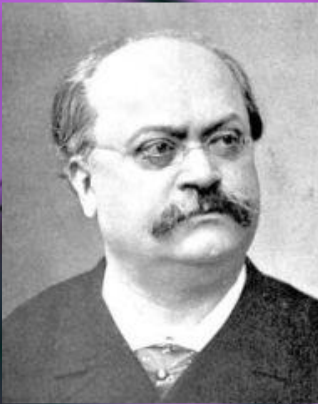
Шарль Лекок (1832 – 1918 г.г.)