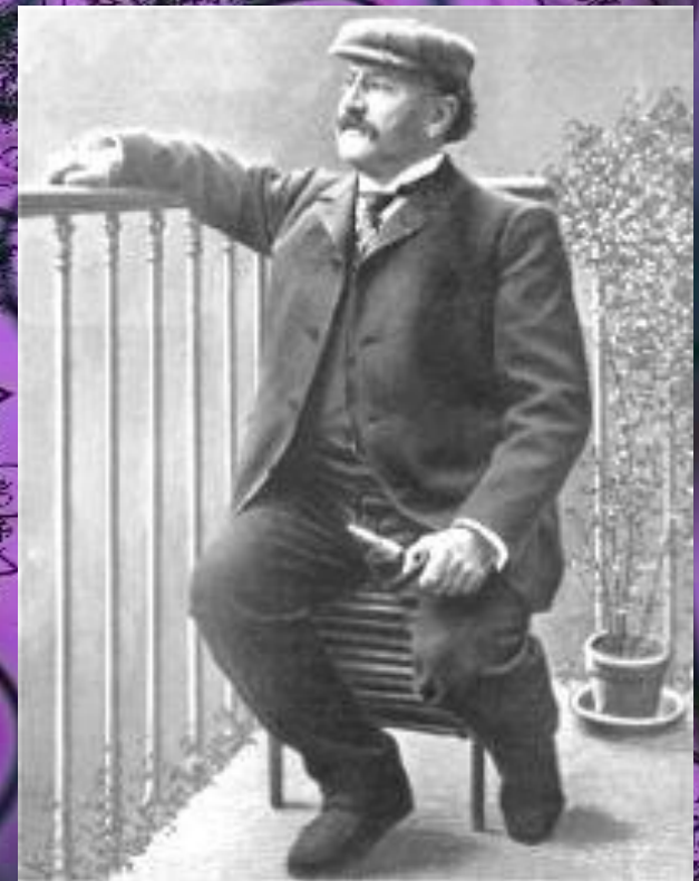
Робер Планкетт (1848 – 1903 г.г.)