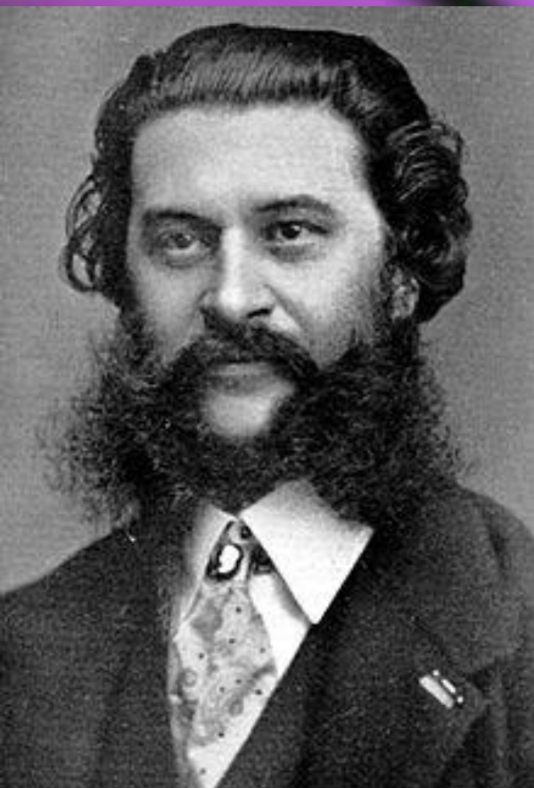
Иоганн Штраус (1825—1899 г.г.)