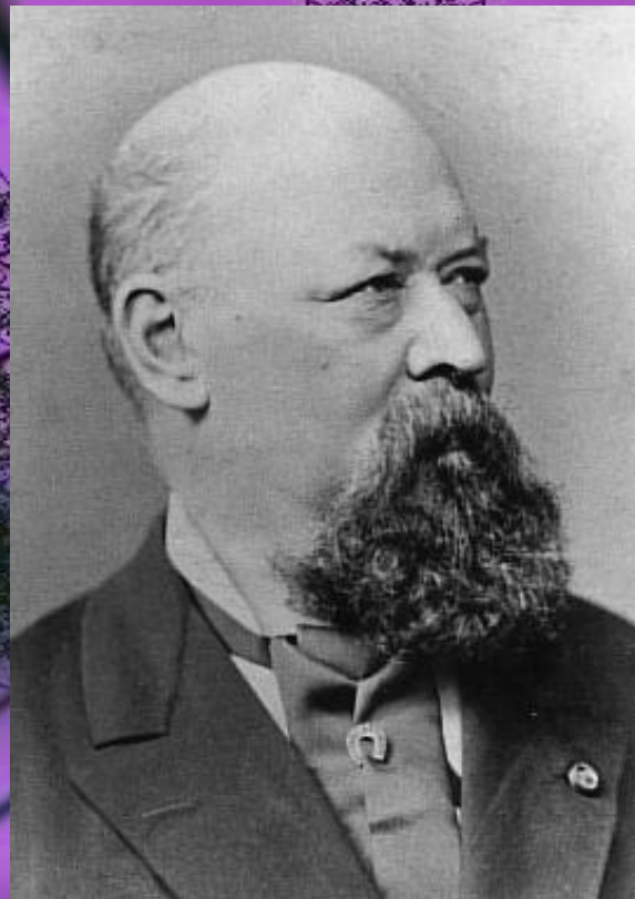
Франц фон Суппе (1819 —1895 г.г.)