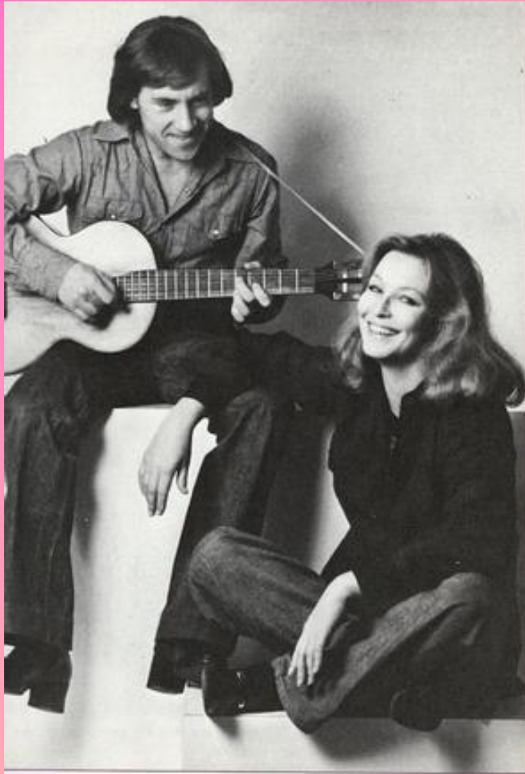
В.Высоцкий М. Влади