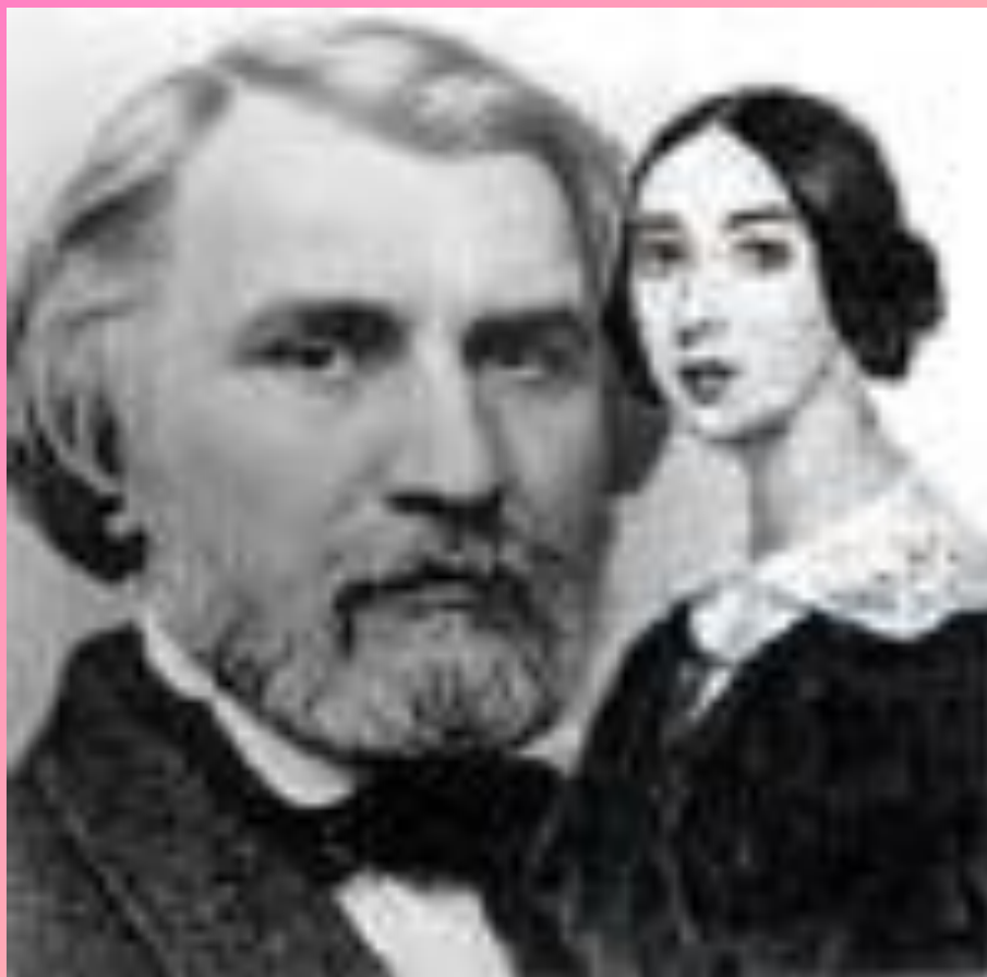
И.Тургенев и П.Виардо