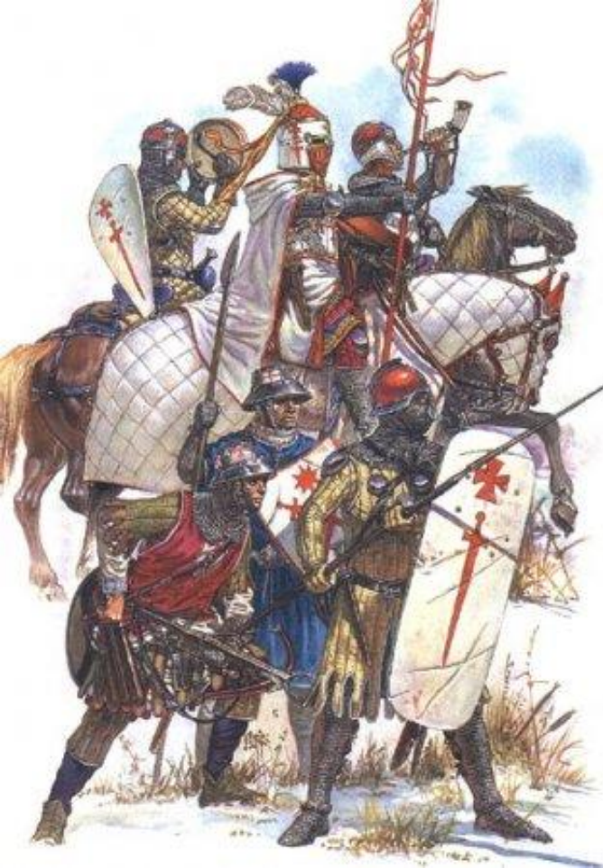
Ледовое побоище 05.04.1242 г.