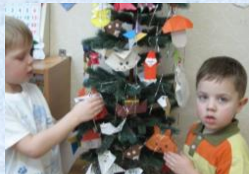
Елка наряжается только фигурками оригами, сделанными нами в совместной деятельности