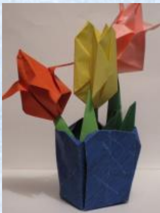
Красивые цветы для любимой мамы