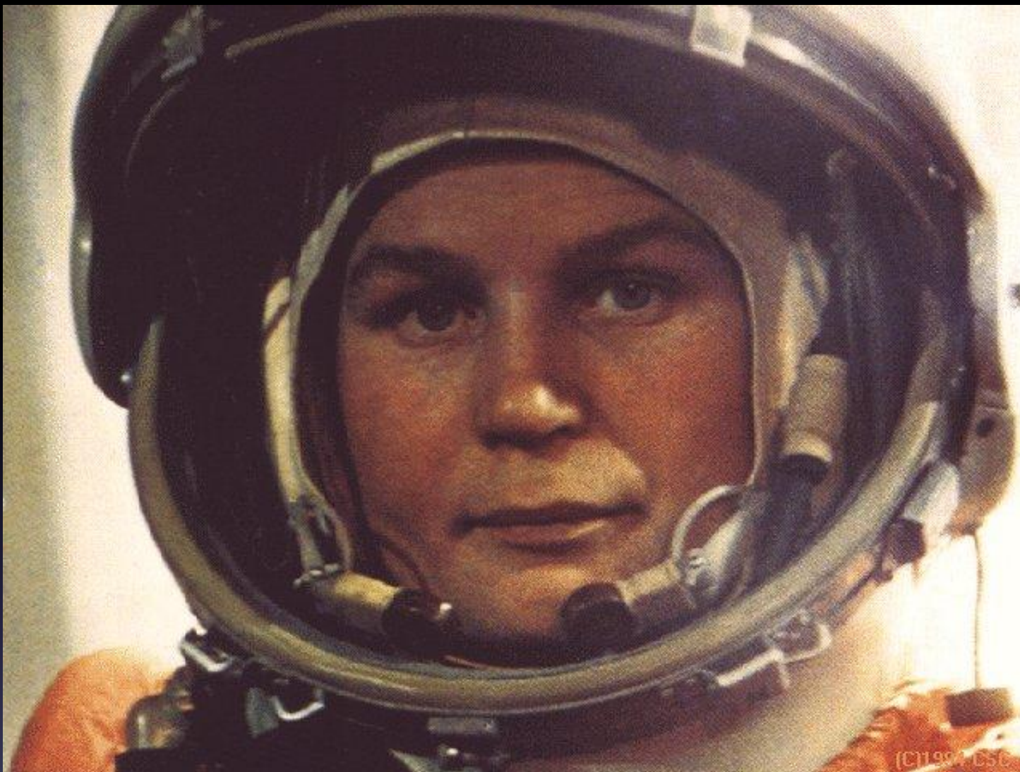
Ярославская земля вырастила первую в мире женщину – космонавта Валентину Владимировну Терешкову поднявшуюся в космос в 1963 году.