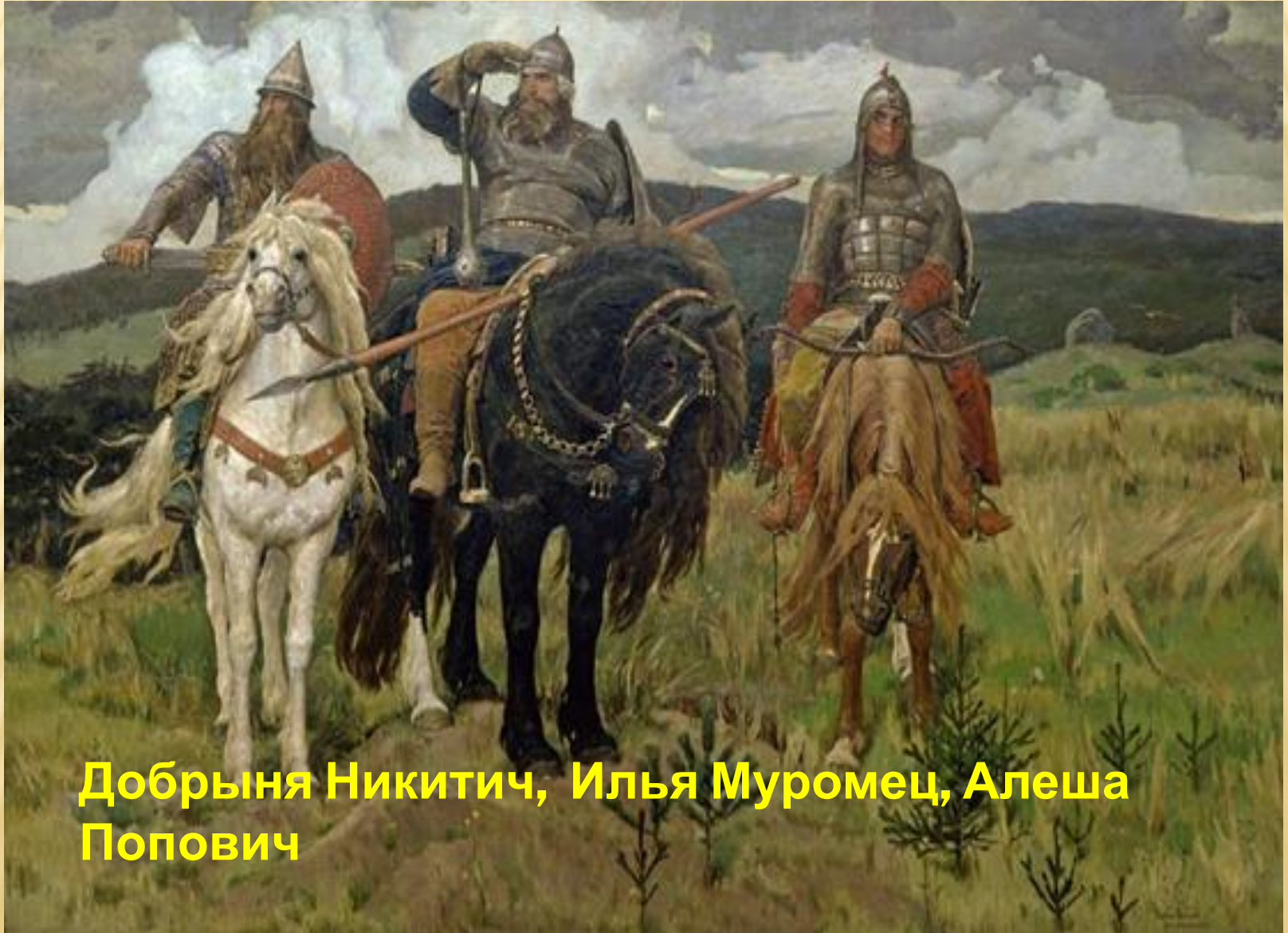
Добрыня Никитич, Илья Муромец, Алеша Попович

ГЛАВНОЕ, ЧТО ОБЪЕДИНЯЕТ ГЛАВНЫХ ГЕРОЕВ, – ТО, ЧТО ЭТИ ЛЮДИ НАДЕЛЕНЫ НЕЧЕЛОВЕЧЕСКИМИ ВОЗМОЖНОСТЯМИ.