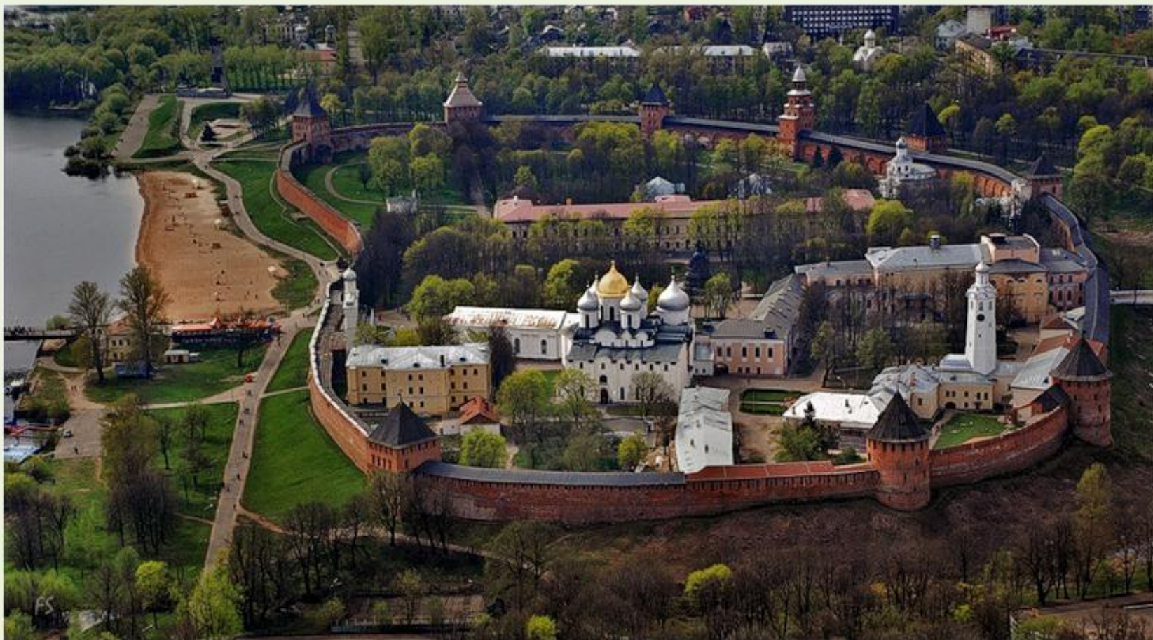
Новгородский детинец. Современная аэрофотосъемка