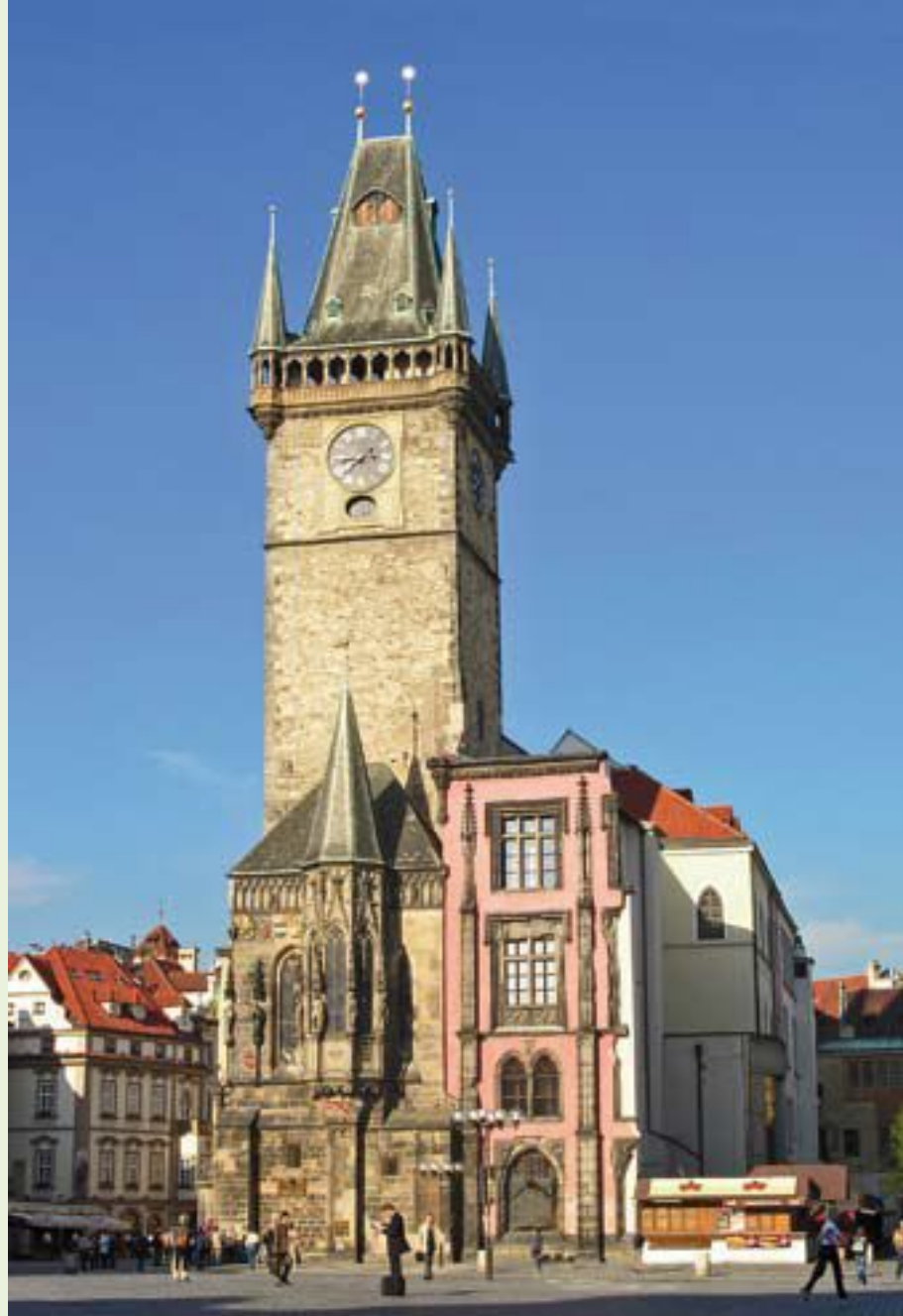
Площадь и здание городской ратуши. Прага