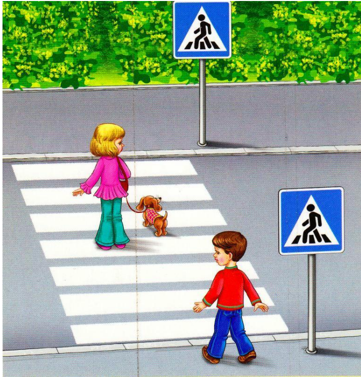
Пешеходный переход (наземный)