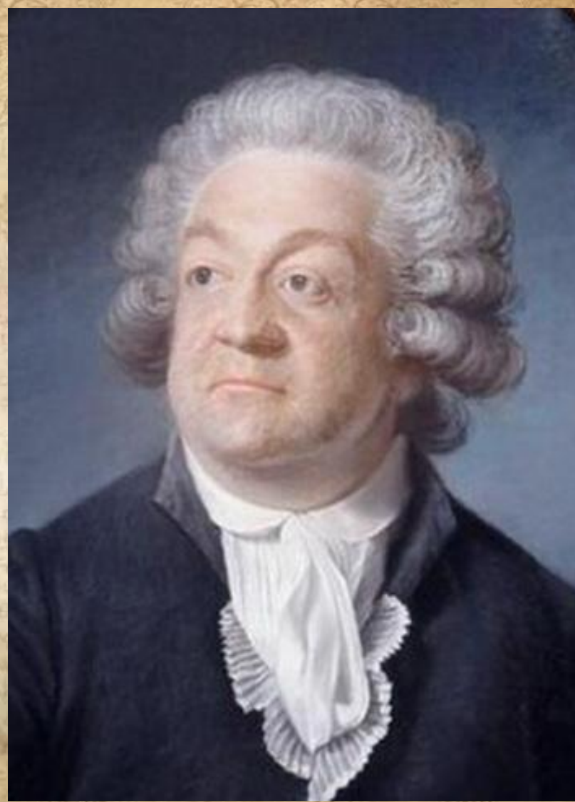
Труд П.Ш.Левека «Российская история»

въ Типографіи Компаніи Типографической, съ Указнаго дозволенія, 1787.