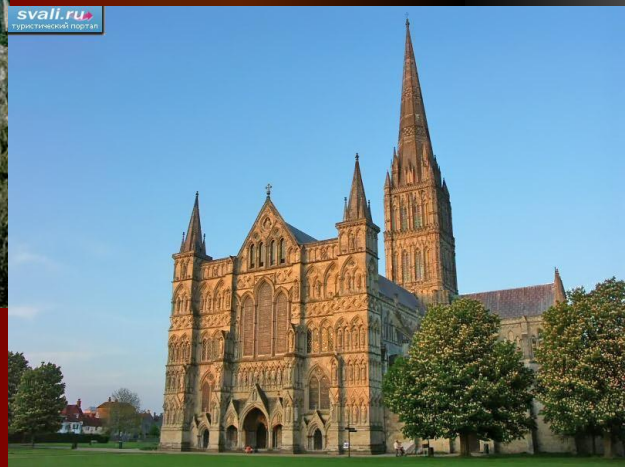
в) Англия - 122