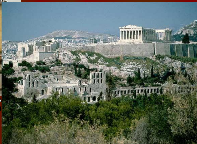
б) Греция - 154