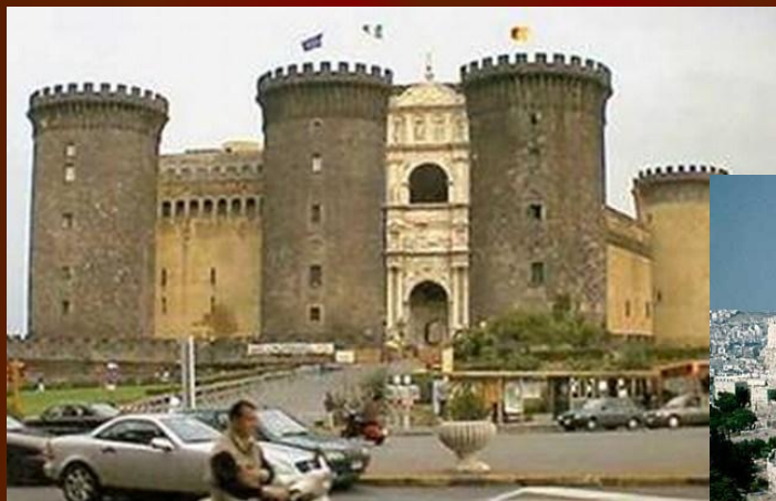
а) Италия - 176