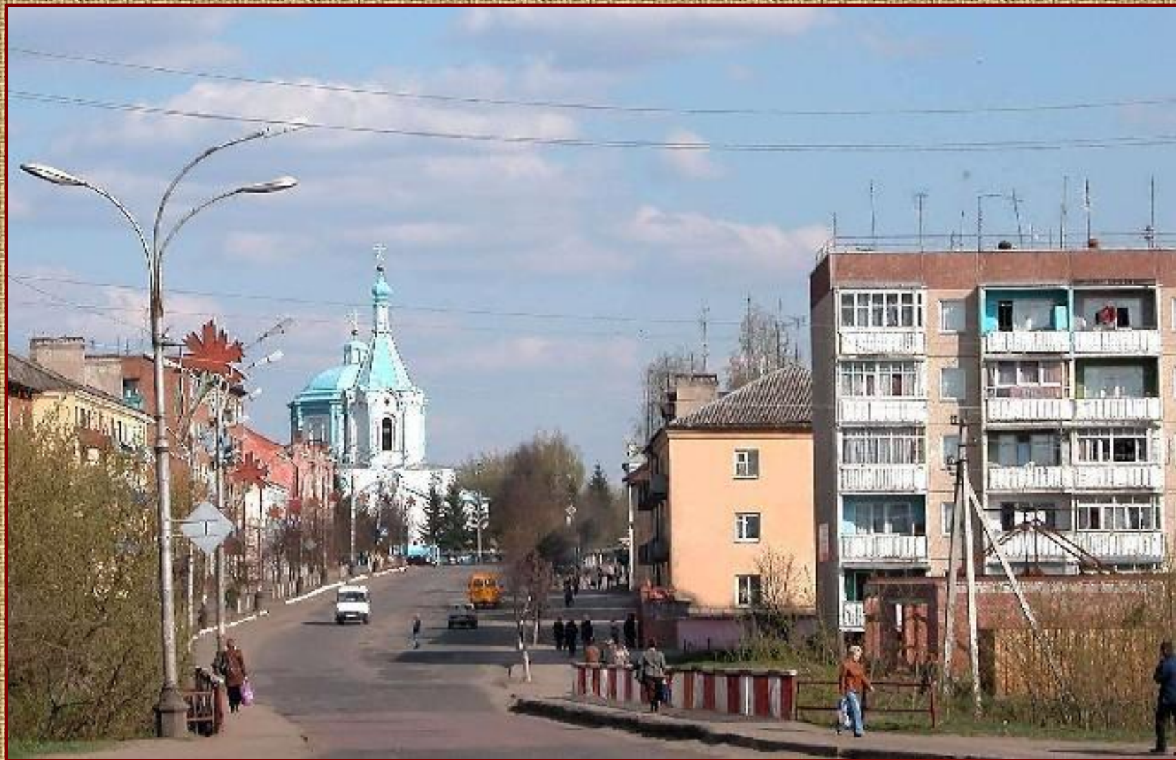
Одна из главных улиц города – улица Советская