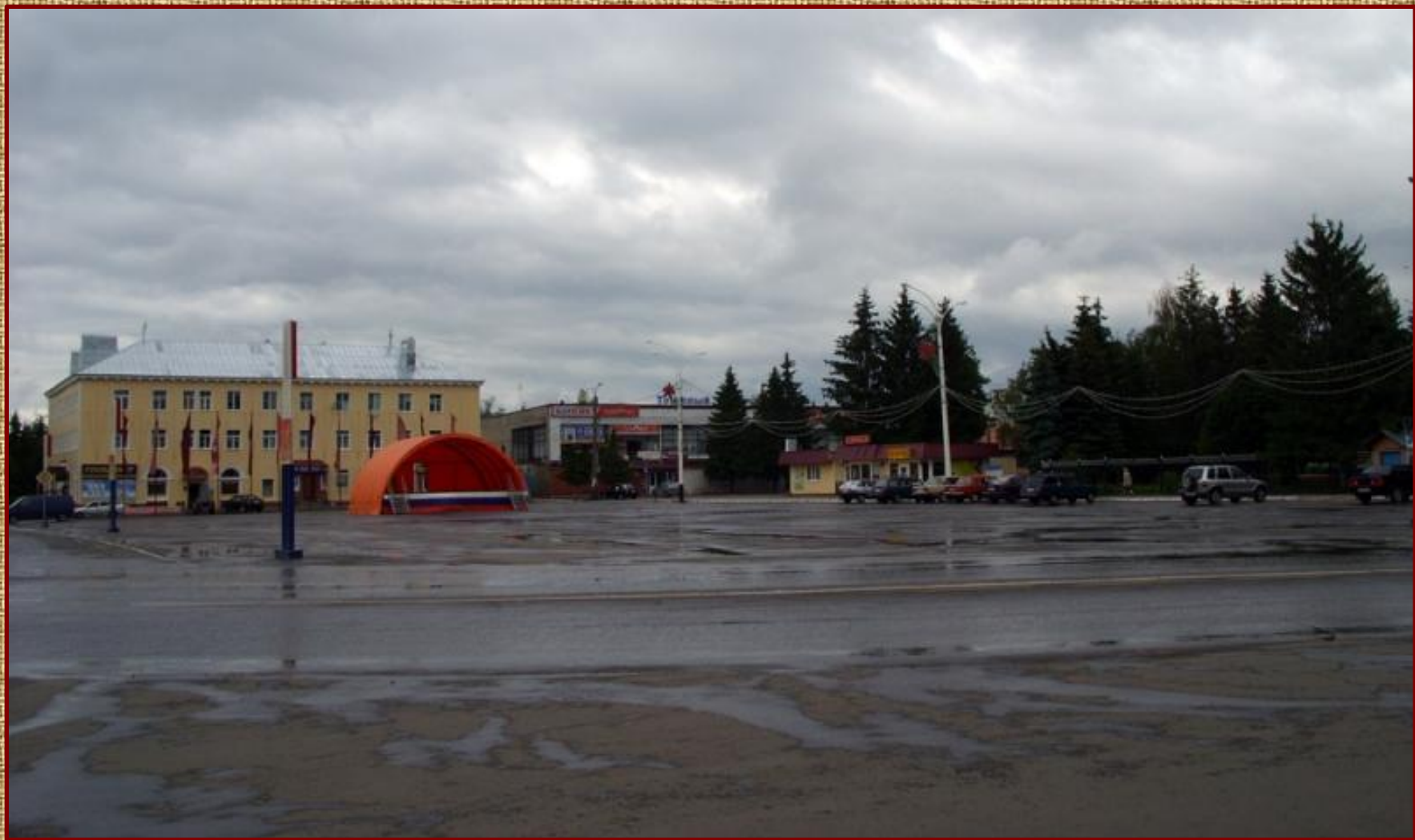
Центральная площадь города