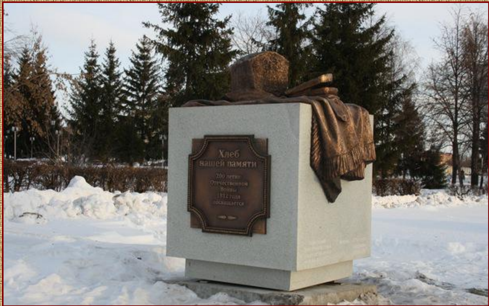
Памятник бородинскому хлебу