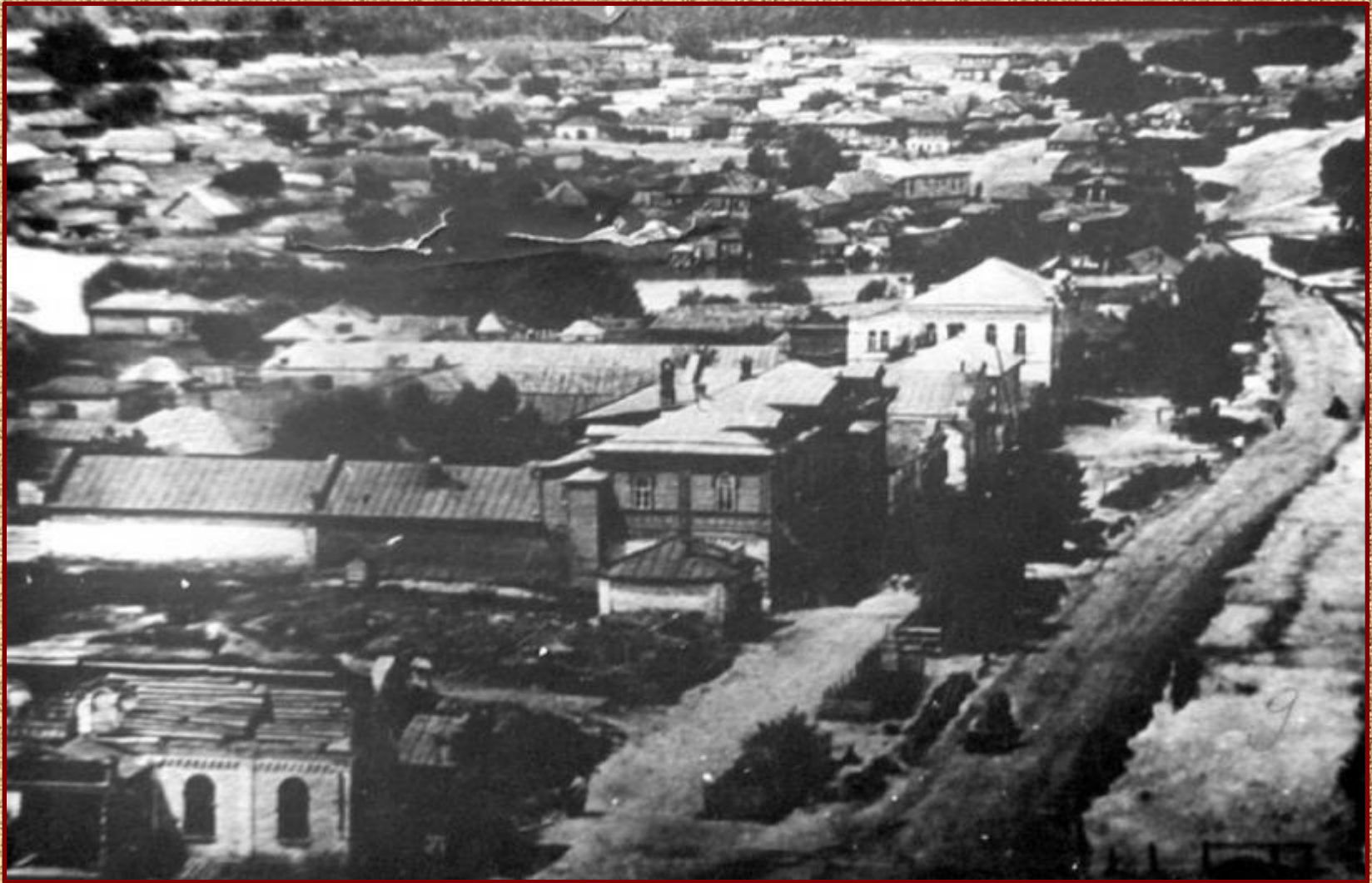
Улица Миллионная (сегодня ул. Пушкина)