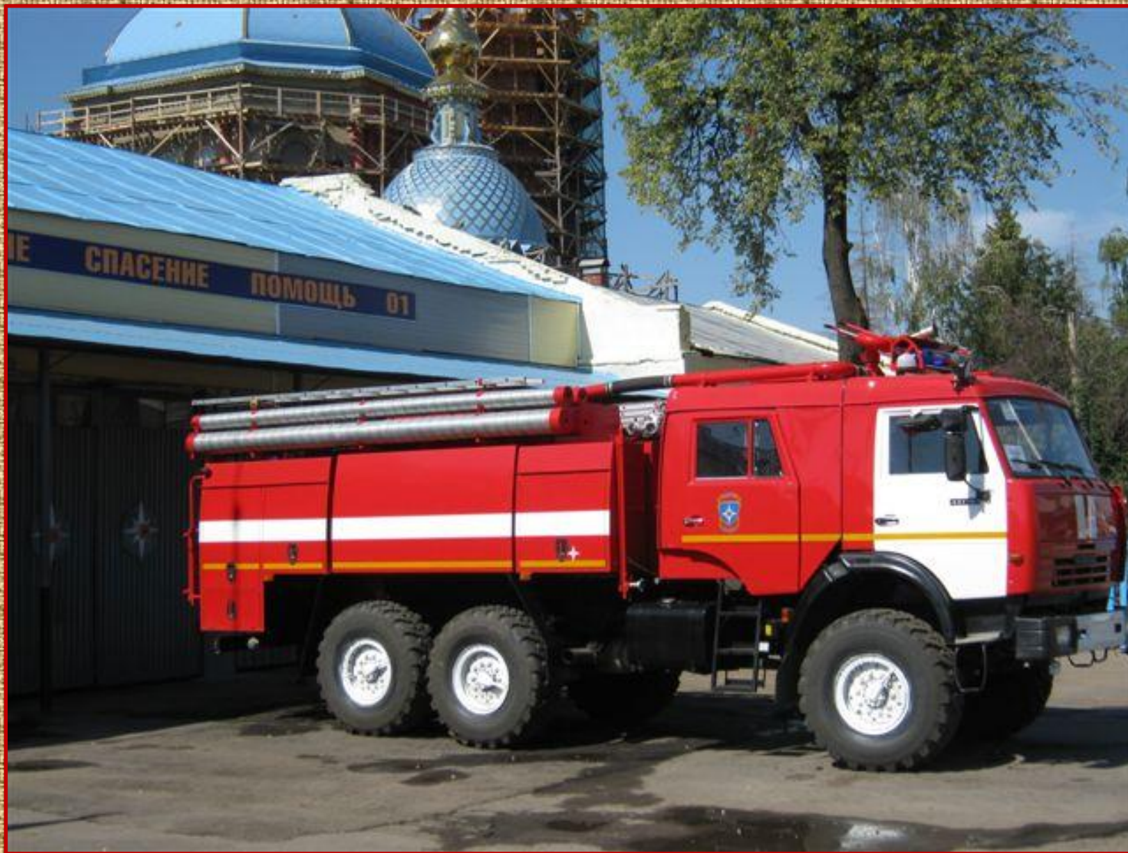
Пожарная часть №24