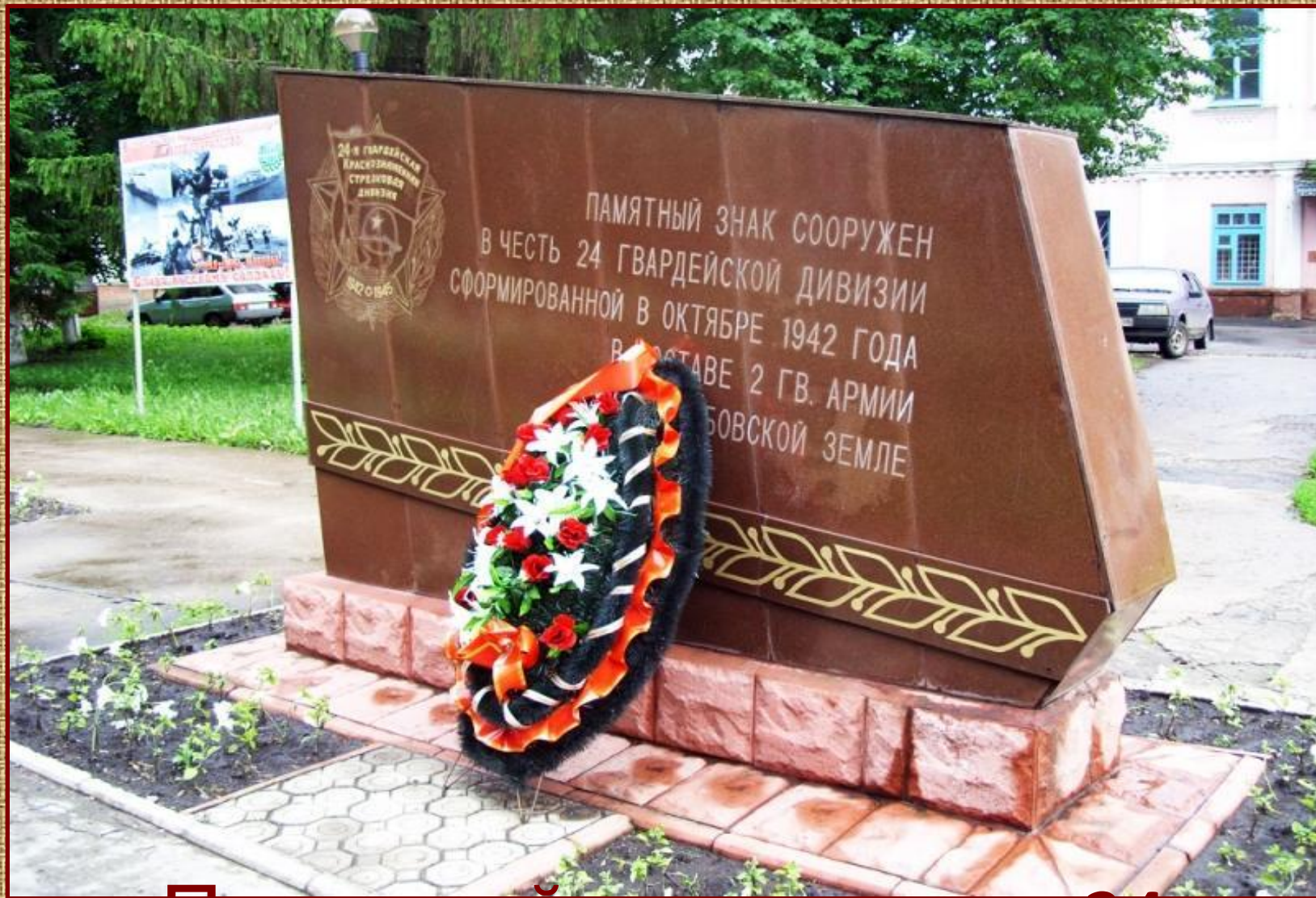
Памятный знак в честь 24 гвардейской мотострелковой дивизии