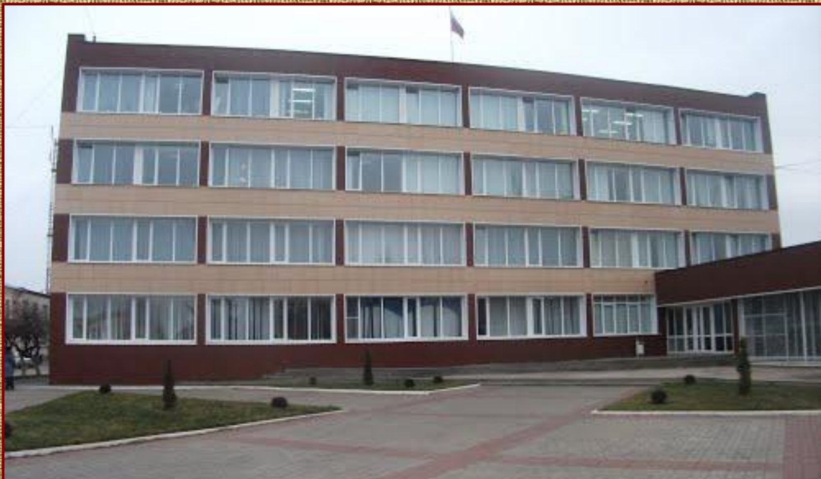
Здание Администрации города