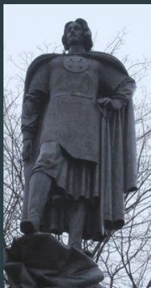
Орден Александра Невского, учреждённый Екатериной II