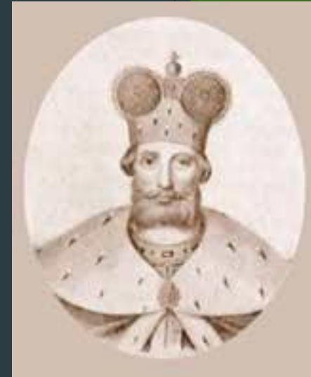
Ярослав II Всеволодович, отец Александра

родился в ноябре 1220 года (по другой версии 30 мая 1220 года) в семье князя Ярослава II Всеволодовича и рязанской княгини Феодосии Игоревны.