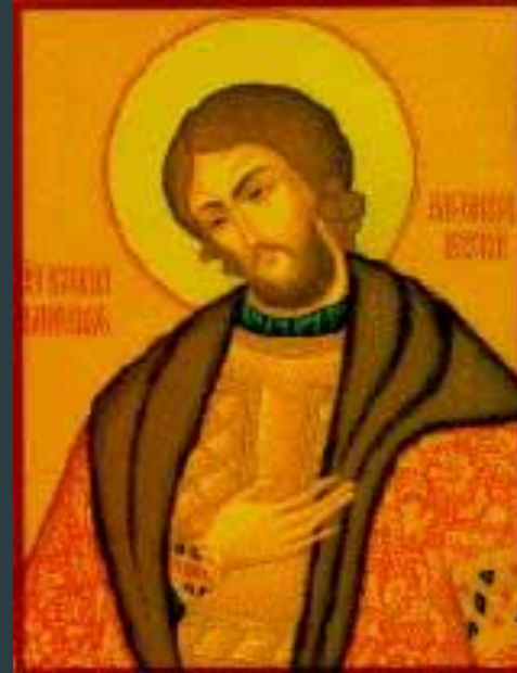
Икона Александра Невского