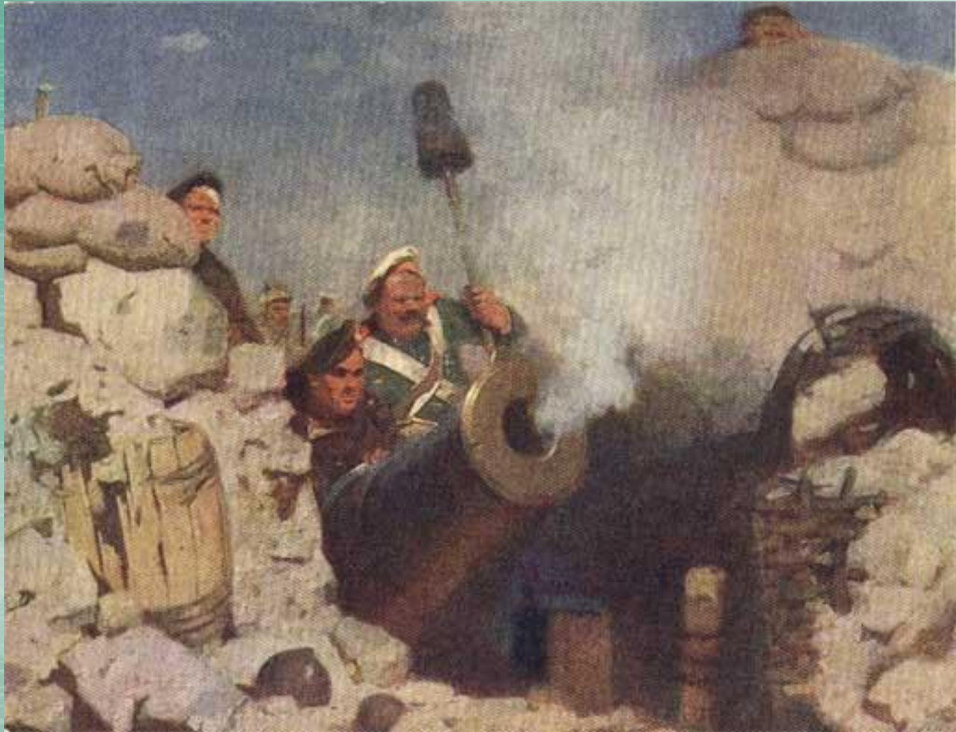
Удачный выстрел Художник А.В.Кокорин.