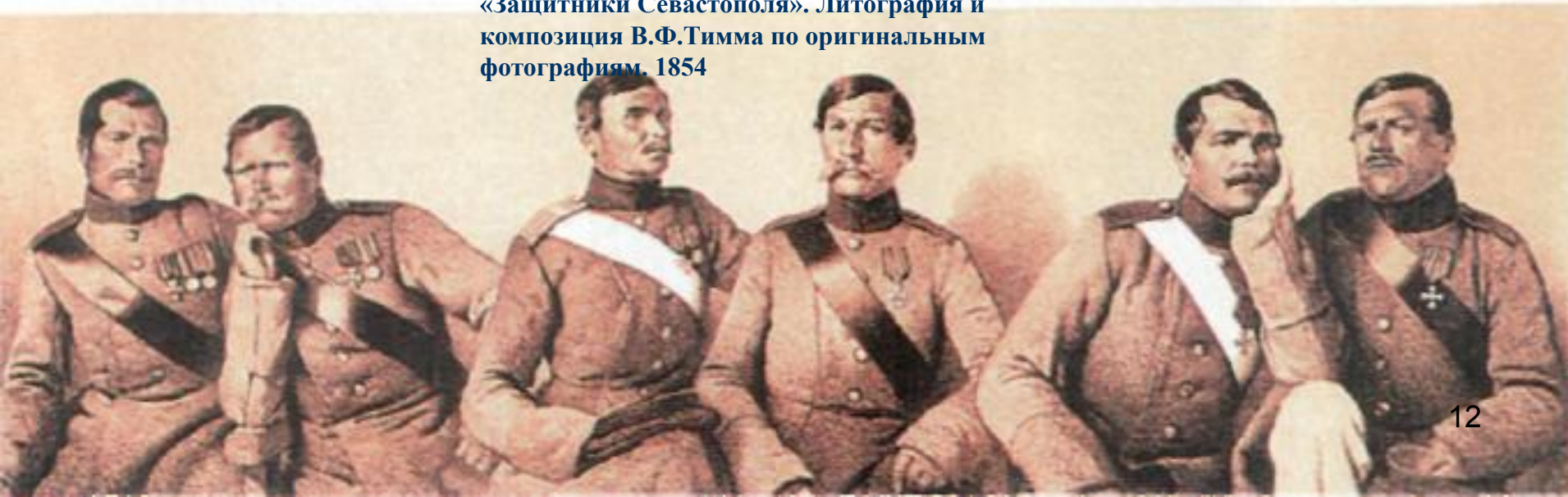
«Защитники Севастополя». Литография и композиция В.Ф.Тимма по оригинальным фотографиям. 1854