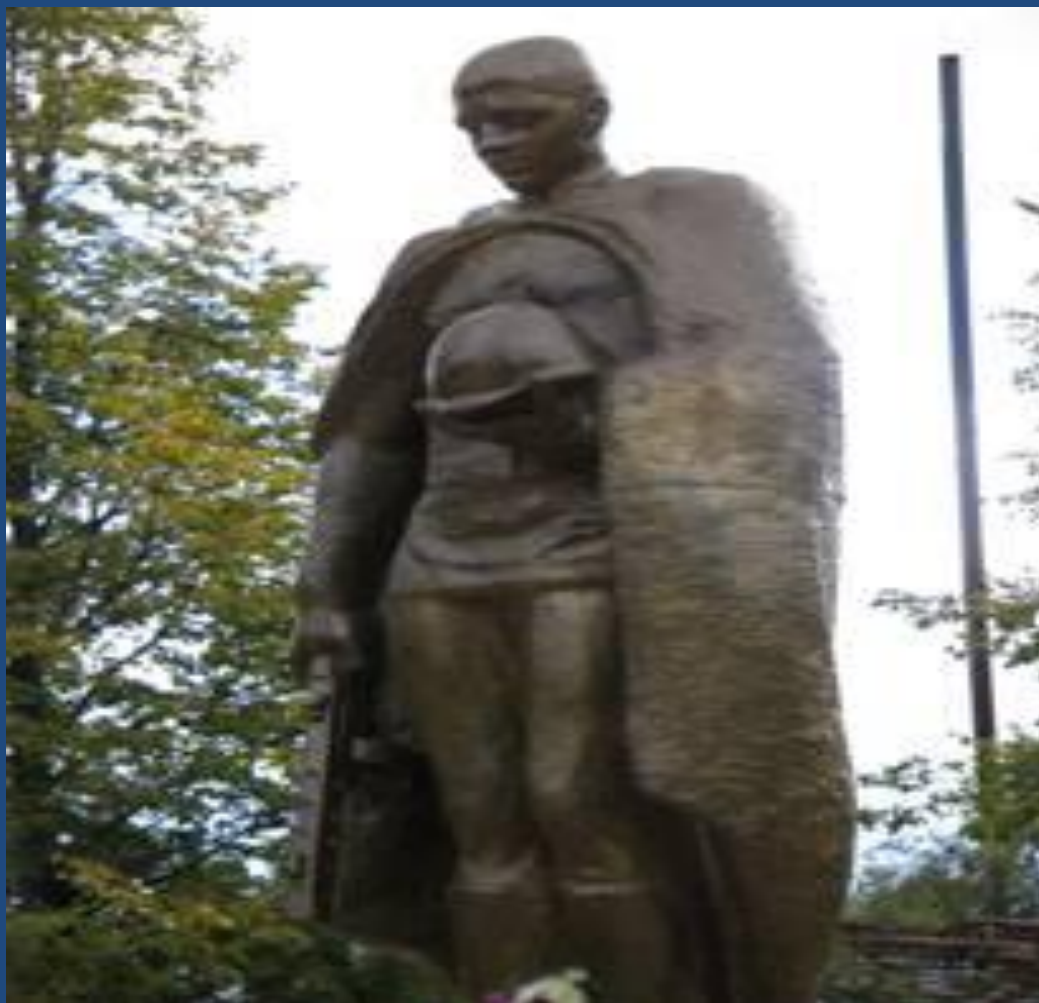
Памятник неизвестному солдату в п. Угра