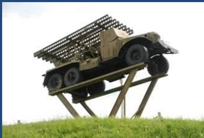
Памятный знак батареи «Катюша» в с. Знаменка