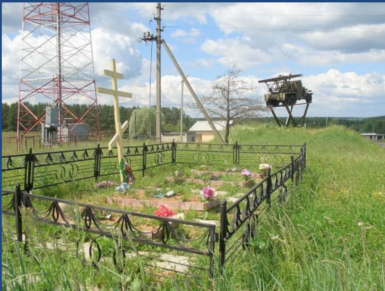
Могила боевого расчёта "катюши". Посёлок Знаменка