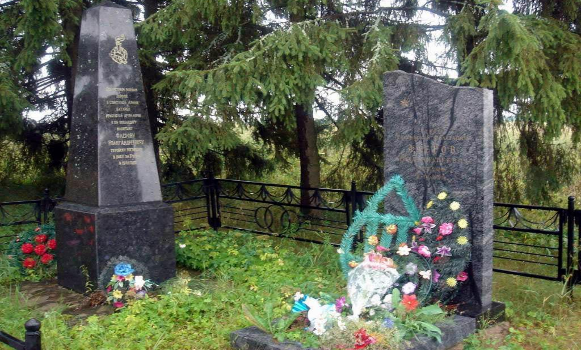
Памятник Ивану Андреевичу Флерову