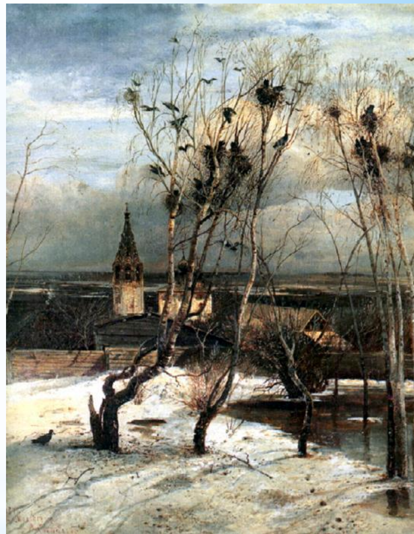
Грачи прилетели. А.К.Саврасов