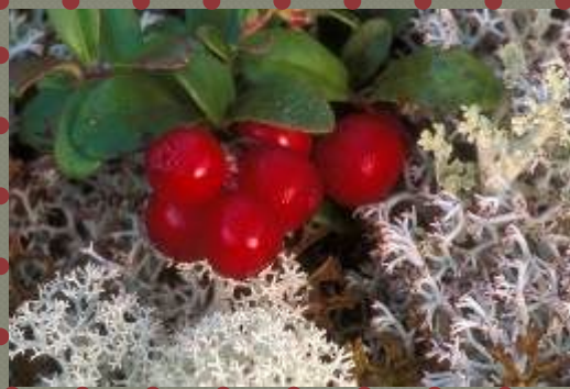
Ягель и брусника