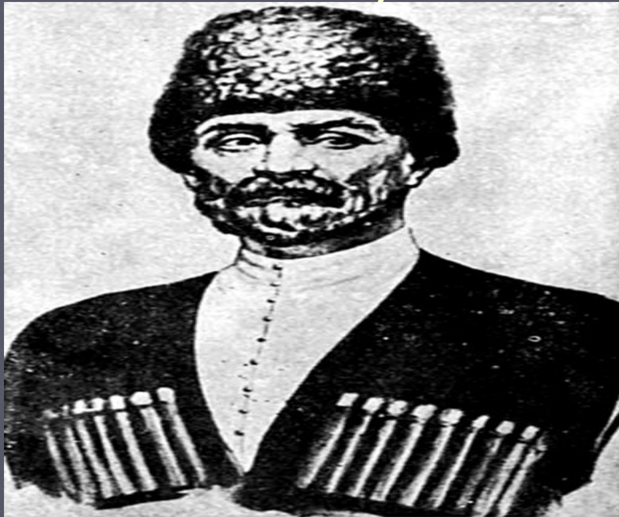
Ш. Б. Ногмов. Художник И. В. Балицкий. 1950-е годы.