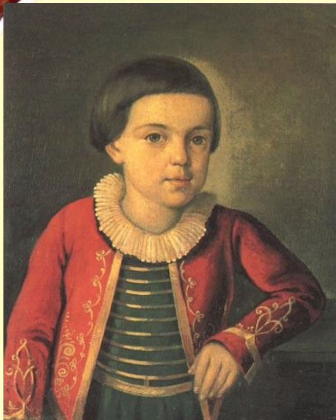
Самый ранний из известных портретов Лермонтова (1820-1822 год)