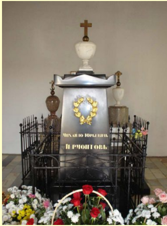
Могила М.Ю. Лермонтова