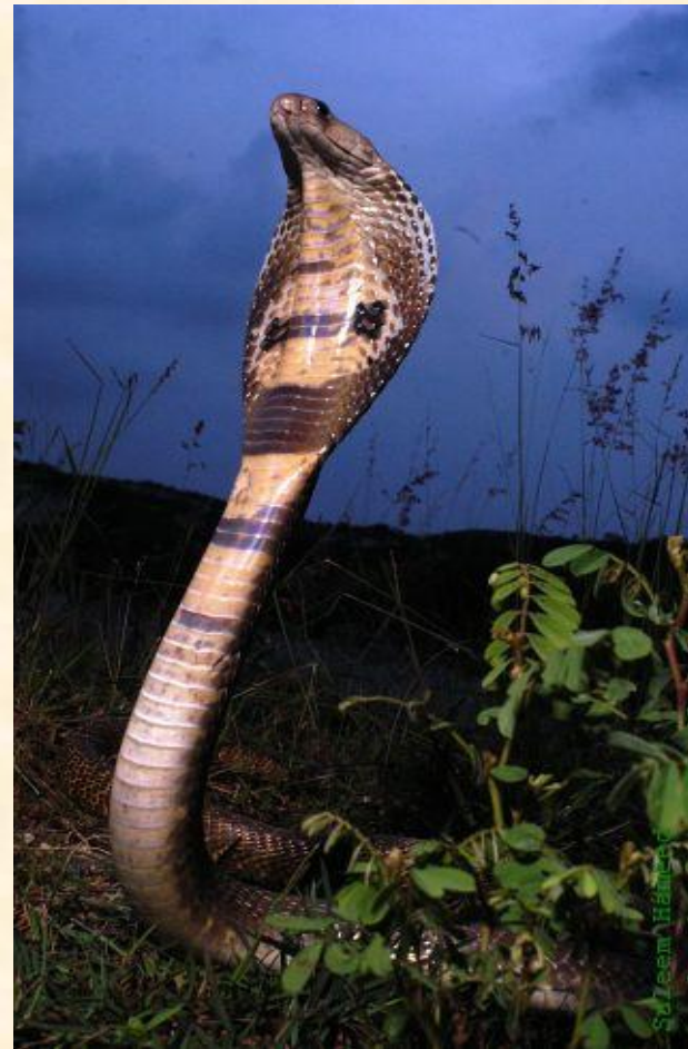
Индийская кобра или очковая кобра встает в специальную позу для нападения.