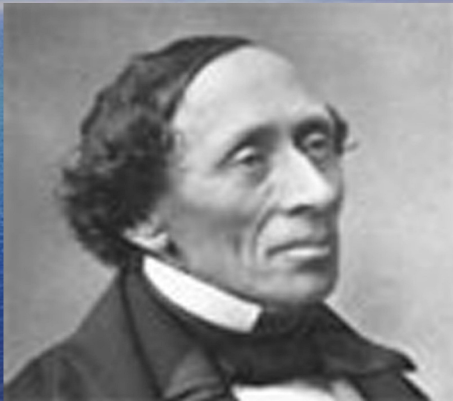
Ганс Христиан Андерсен