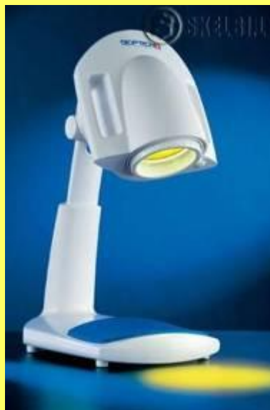
медицинский прибор «Биоптрон»