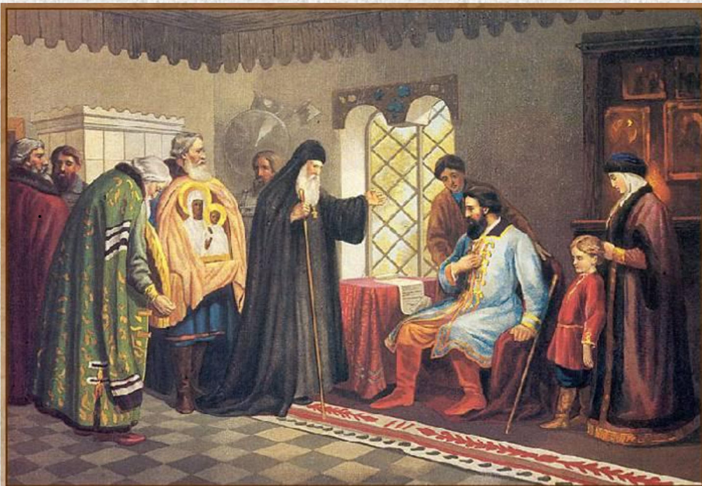
Нижегородские послы у князя Дмитрия Пожарского. 1611 г.