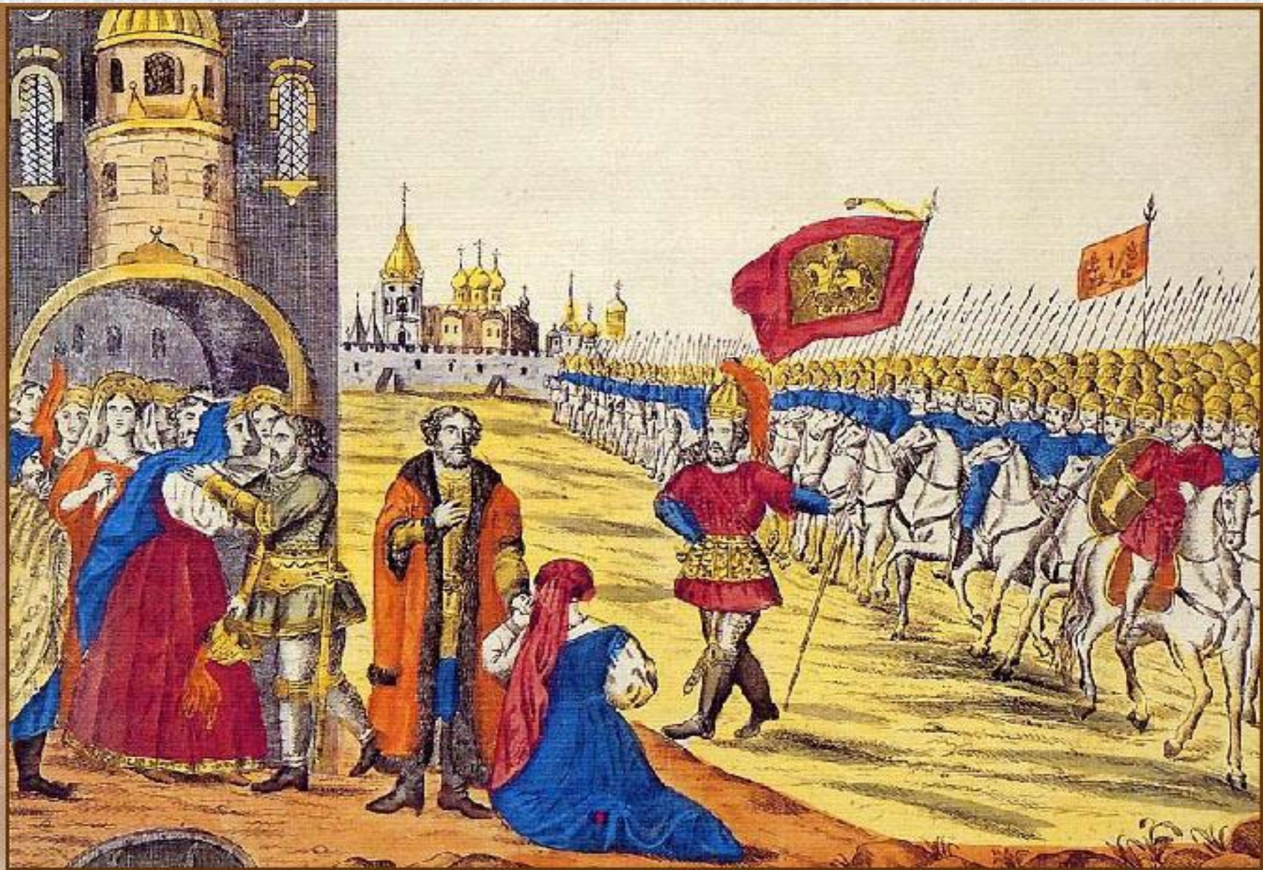
Гражданин Минин и князь Пожарский