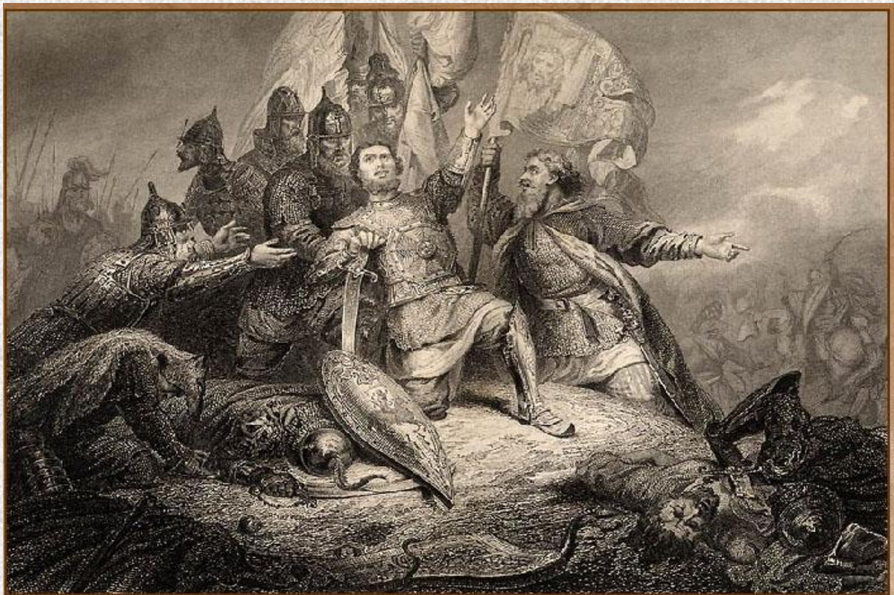
Пожарский в битве под Москвой