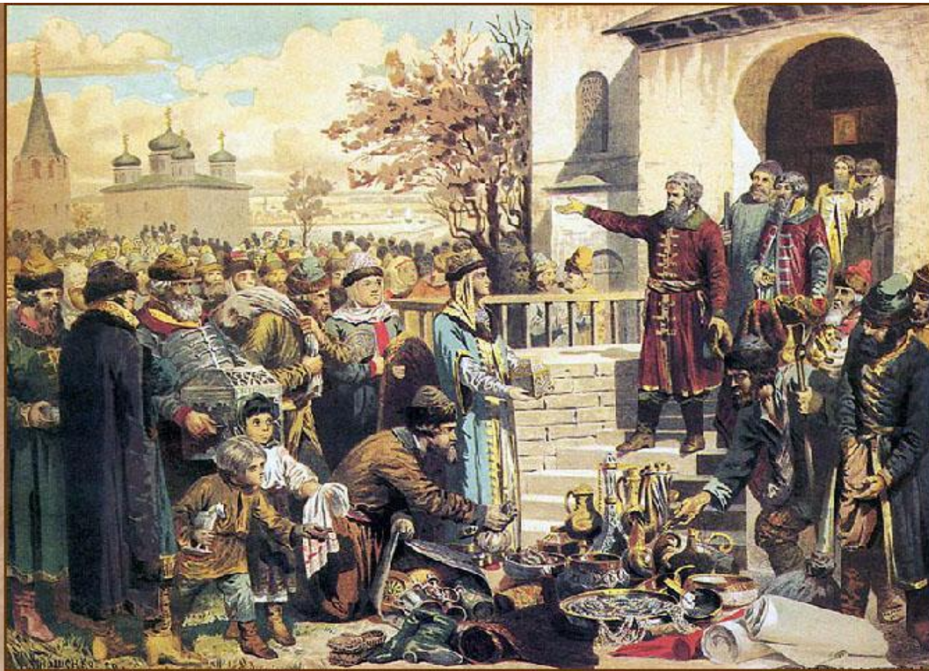
Воззвание Козьмы Минина к нижегородцам

Осенью 1611 г. по призыву нижегородского купеческого старосты К. Минина началось формирование народного ополчения.