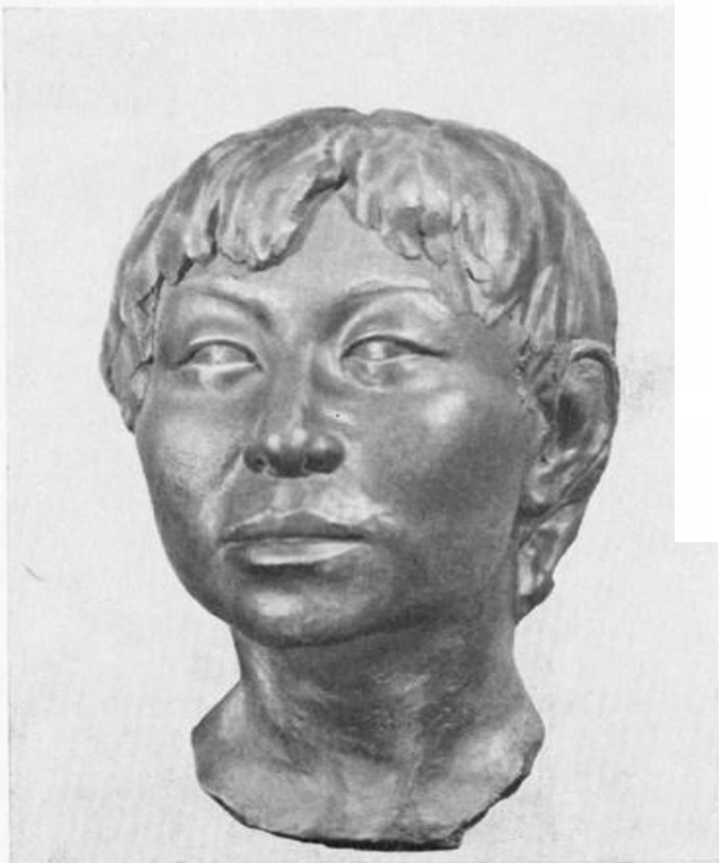
ТАБЛИЦА VIII СКУЛЬПТУРНАЯ РЕКОНСТРУКЦИЯ ПО ЧЕРЕПУ ЖЕНЩИНЫ ИЗ МОГИЛЬНИКА ФОФАНОВО АВТОР Г. В. ЛЕБЕДИНСКАЯ

Скульптурная реконструкция по черепу женщины из могильника Фофаново.