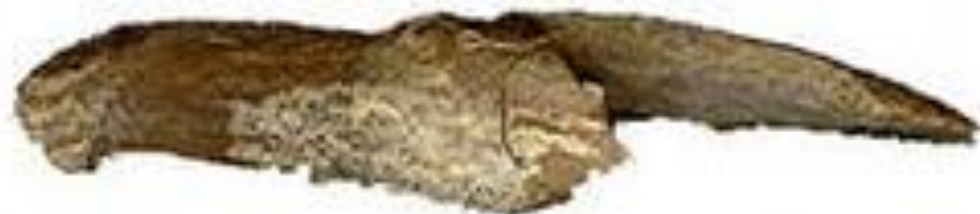
Инструменты из могильника Фофаново

Скульптурная реконструкция по черепу женщины из могильника Фофаново.