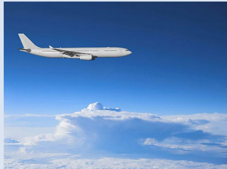
Вид с самолёта