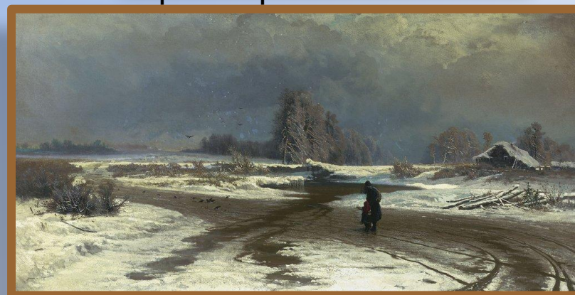
«Оттепель» Ф. Васильев