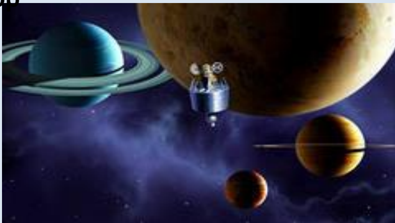
Вид с космоса