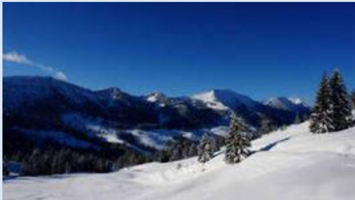
Вид с высоких гор