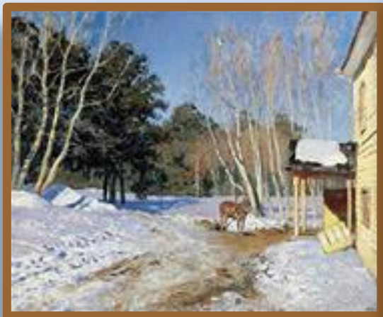
«Март» И. Леритан