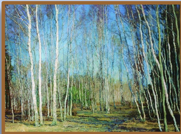
«Голубая весна» В. Бакшеев