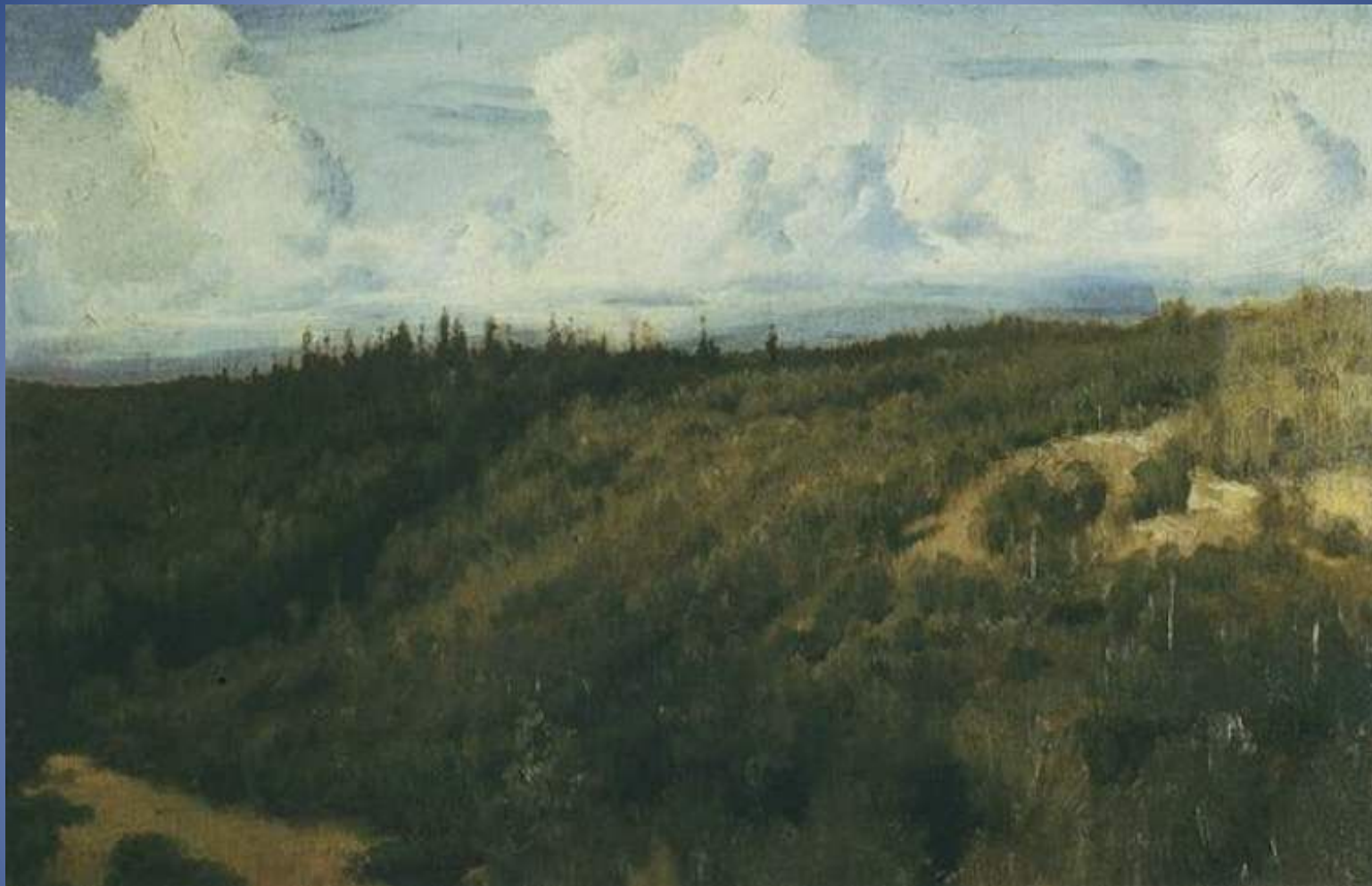
В.М. Васнецов Пейзаж под Абрамцевым Этюд для картины "Богатыри" 1881г, холст, масло, Государственная Третьяковская галерея, Москва.