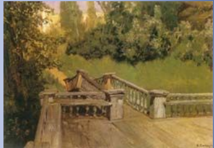
Ахтырка. Эюд. 1879, холст, масло.