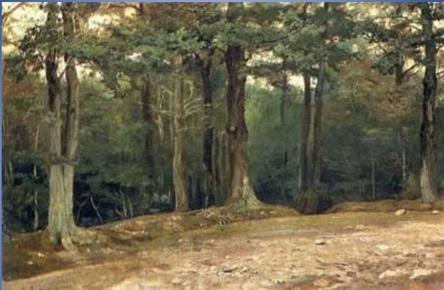
В.М. Васнецов . В парке Конец 1870-х, холст, масло, Государственная Третьяковская галерея, Москва.