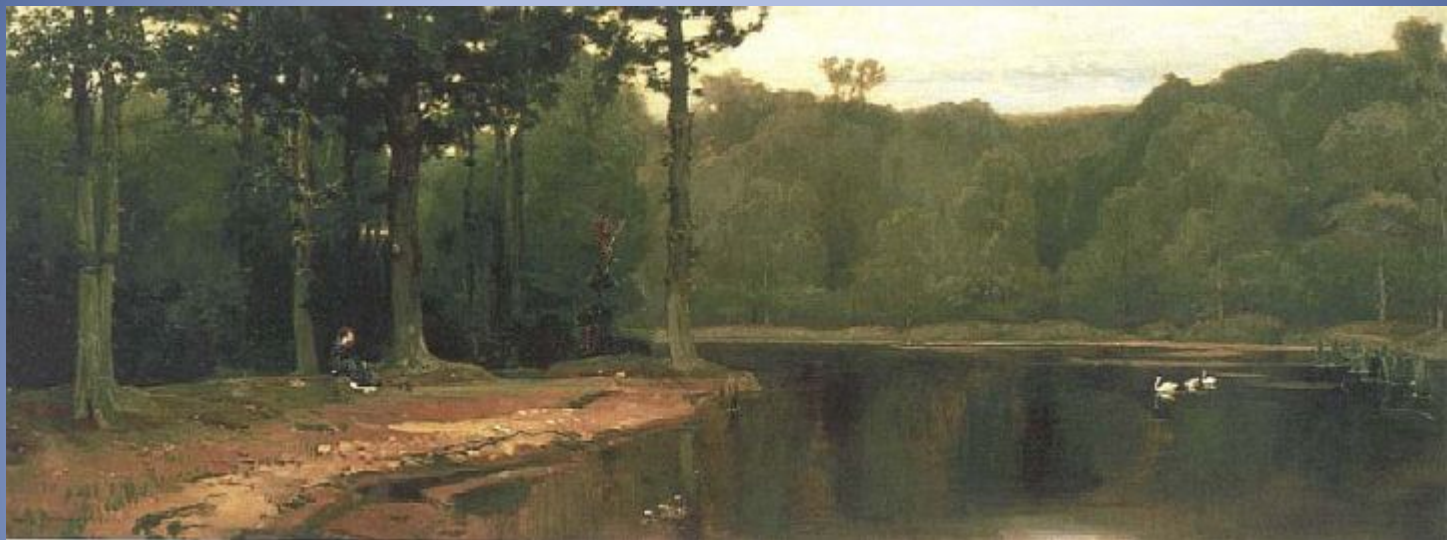
В.М. Васнецов . Затишье 1881г, холст, масло, Государственная Третьяковская галерея, Москва.