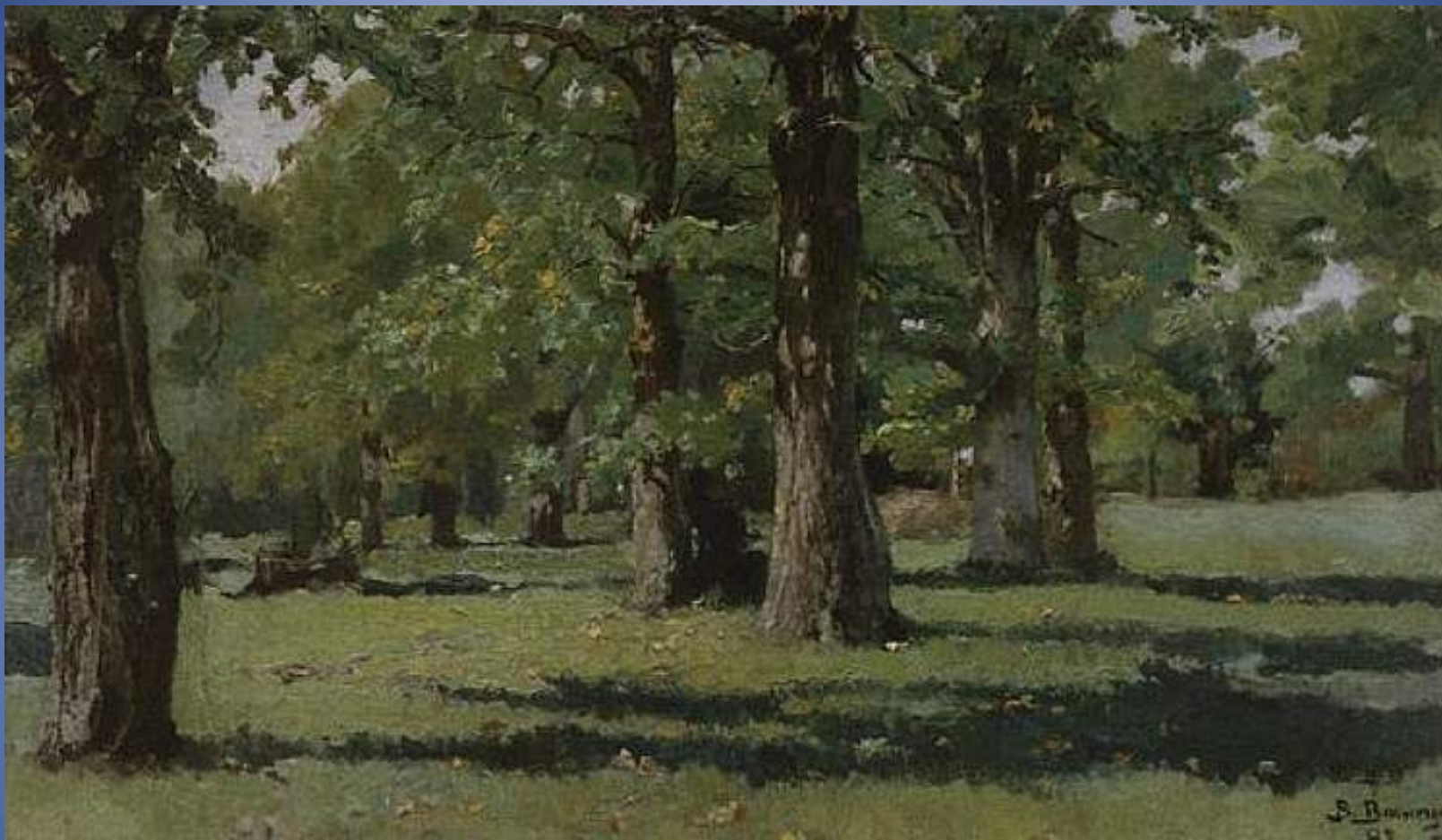
Дубовая роща в Абрамцево 1883г, холст, масло, Государственная Третьяковская галерея, Москва.