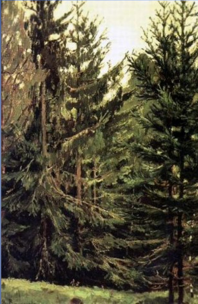
В. М. Васнецов. Опушка елового леса Этюд к картине "Аленушка" 1881г, холст, масло, Государственная Третьяковская галерея, Москва.