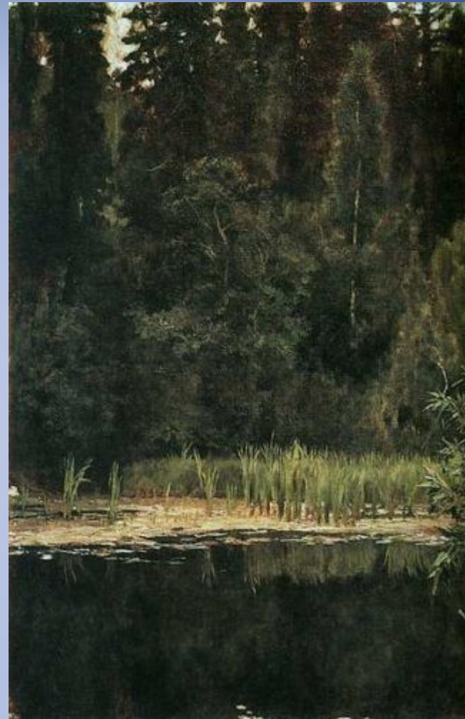
В.М. Васнецов . Алёнушкин пруд ( Пруд в Ахтырке ) 1880г, холст, масло, Государственный историко-художественный и литературный музей-заповедник "Абрамцево", Московская область