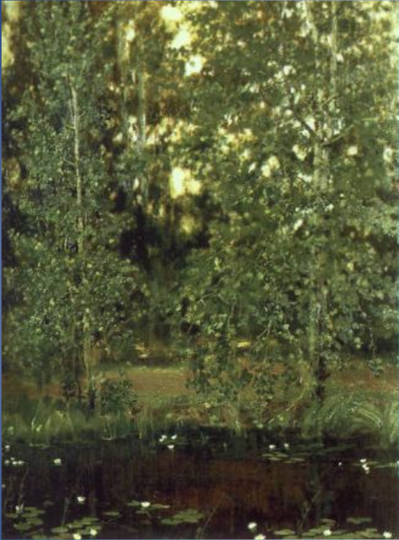
Пруд в Ахтырке 1880г, холст, масло, Государственная Третьяковская галерея, Москва.