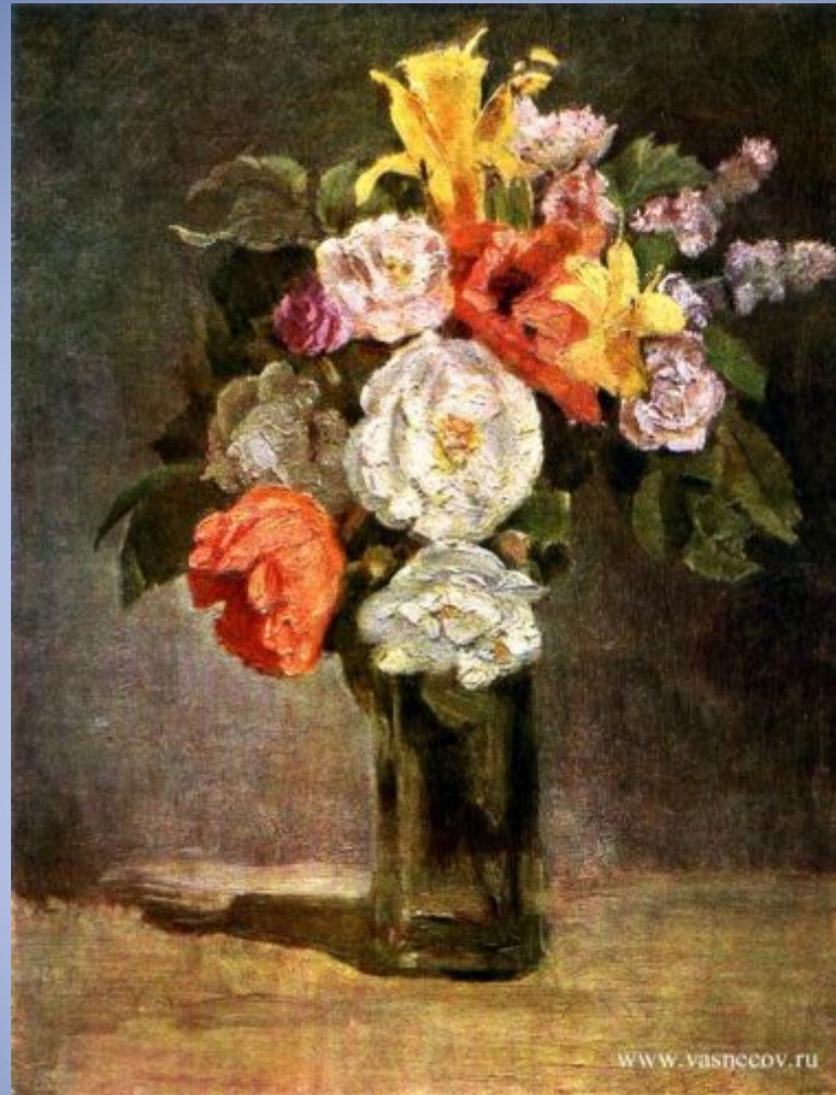
Букет. 1880 г. Холст, масло.